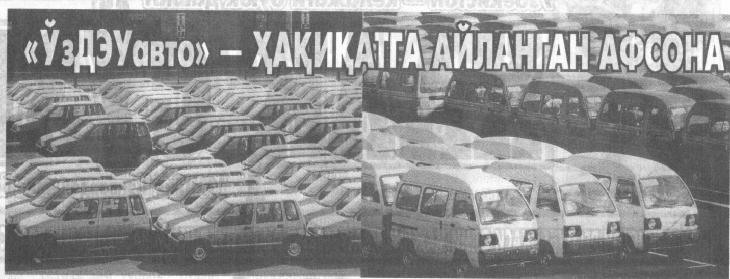
«Ўздэуавто» — ҳақиқатга айланган афсона

Шундан сўнг орадан ролпа-роса 28 кун ўтиб, барчамиз шитиорлик билан кутган муборак кун — мамлакатимиздаги илк автомобил заводининг очилиши — тантиқа куларига ҳам етиб келдик. Ишга тушган завод, унинг қурилиш суратлари, юксак техник даражаси — яна бир бор Ўзбекистон тантиқчили имзоланди.