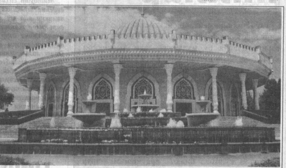
Амир Темур хийбони гўзал бир узук бўлса, бу музей шу узукнинг ёқут кўзидир.

Жак Ширакнинг иштироки, ЮНЕСКО Бош директори Ф. Майорнинг эса юртимиз ҳақида тўққизлаб лутф қилиши, шундай машаққатли ўтиш даврида мамлакатни бошқараётган ИНСОН иродасига қўйил қолганлиги фикримиз исботидир.