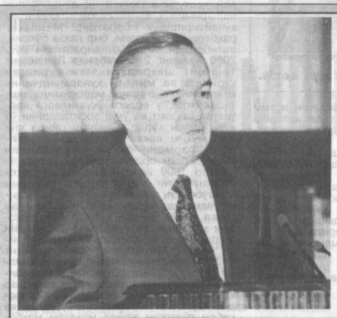
2000 йил 22 январ. Ислам Каримов Олий Мажлисининг биринчи сессиясида Президентини лавозимига расмий киришиш маросимида қасамд қабул қилаётган пайт.