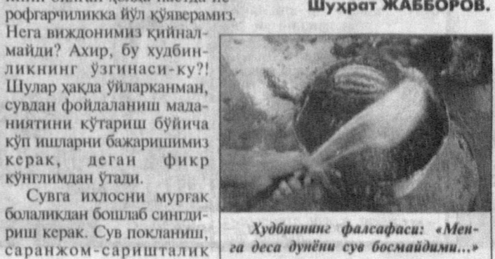
Худбининг фалсафаси: «Мен-да дунёни сув бошлайдими...»

йўлида муҳим ўрин тутгани каби унга нисбатан қандай муносабатда бўлиш инсон маънавий оламнинг даражасини билдиради. Сувини тежаган, уни керакли ўзанига йўналтирган одам Ватан қадрини юракдан англайди. Негаки, сув ҳам она юртимиз табиатининг бир бўлаги бўлиб, унга кўрсатилган меҳр жонанон Ватанга бўлган муҳаббатимиз билан ҳамбарчас боғлиқ кетган. Ушбу сатрларни ёзиб бўлдим му муалек сувлан бич-тибела сипқорим. Ташна қўлим оби ҳаёт чашмасидан қонангилни боис танамда ажиб ҳолат пайдо бўлди. Қаранг, сув инсон учун қанчалик ҳаётбахш неъмат! Уни исроф қилиш жузла катта увол эканлигини унуттиша ҳақимиз йўқ!