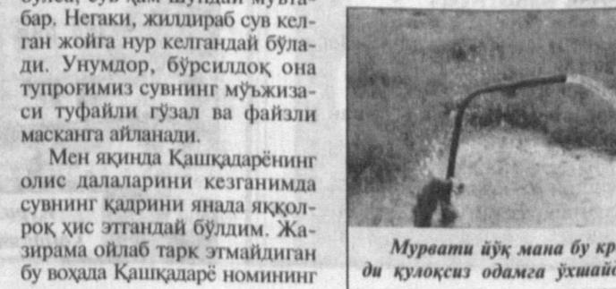
Мураати йўқ мана бу кран худди қулоқсиз одамга ўхшайди.

Халқимиз кечмиши, тақдир суви билан боғлиқ, Азалий қадриятларимизда ҳам сув ҳалоллик, поклик рамзини ифодалаган. Кўнгила эзу гулгуларни жойлаган, вужудда бунёдкорлик рўҳи муҳассам ота-боболаримиз сувининг ҳар қатъинини кўзга тўйиб эйтишган, бу бебаҳо неъматни исроф қилишни эса гуноҳи азим деб билишган. «Эти думалаган сув — ҳалол», «Сув берган — савоб», «Сувдай сероб бўлинг» каби ҳикмати йўришпан халқона ибораларда ҳам бу беизбир неъматнинг қадри улуғланади. Ўзбек учун нон қандай азиз бўлса, сув ҳам шундай мухтаб. Негаки, жонивраб сув келган жойга нур келгандай бўлади. Унумдор, бурсилдоқ она туяроғимиз сувининг мўъжизаси туфайли гузал ва файзли максатга айланади. Мен яқинда Қашқадарьнинг олинс далаларини кезганимда сувининг қадрини янада яққолроқ ҳис этишгай бўлдим. Жазирема ойлаб тарқ этмайдинган бу воқеда Қашқадарь номининг