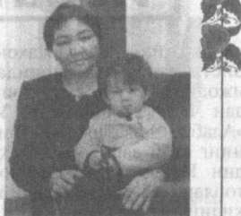
Халима ХУДОЙБЕРДИҒВА Ўзбекистон халқ шoirи

Дунё бир кам, ҳар хил келар Оллоҳнинг қуни. Бош устингда бир кун қайғу Бир кун гуллар шон.