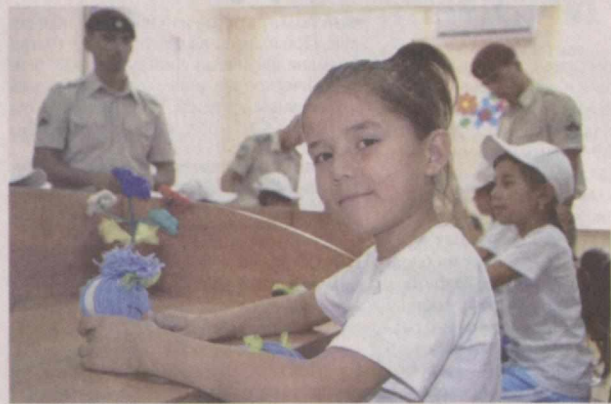
В Международном молодежном лагере города Термеза состоялось мероприятие, посвященное исполнению пяти важных инициатив, вывешенных Президентом нашей страны.

На мероприятии, организованном Сурхандарьинским областным отделением Национальной гвардии Узбекистана и Термезским городским отделением Союза молодежи, состоялся обмен мнениями о роли чтения книг в совершенствовании кругозора человека. Повышена компьютерная грамотность воспитанников дома милосердия № 12, а