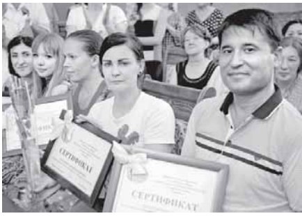
Ана шундай оғир шароитда оиламиз билан 15 йил яшадик. Бугун бизга уч хонадон берилди. Бугун бу жойда кўп қаватли уй қурилиб, атрофи ободонлаштирилди, болалар майдончаси фойдаланишга топширилди.

Миробод туманига ташриф буюрганида ана шу ташландиқ жой ўрнида намунали уй-жой қуриш ва одамларнинг шароитини яхшилаш бўйича тавсия берган эди. Кўп ўтмай туман ҳокимлиги ташаббуси билан бу ерда янги уй қурилиши бошланди. Бугун бу жойда кўп қаватли уй қурилиб, атрофи ободонлаштирилди, болалар майдончаси фойдаланишга топширилди.