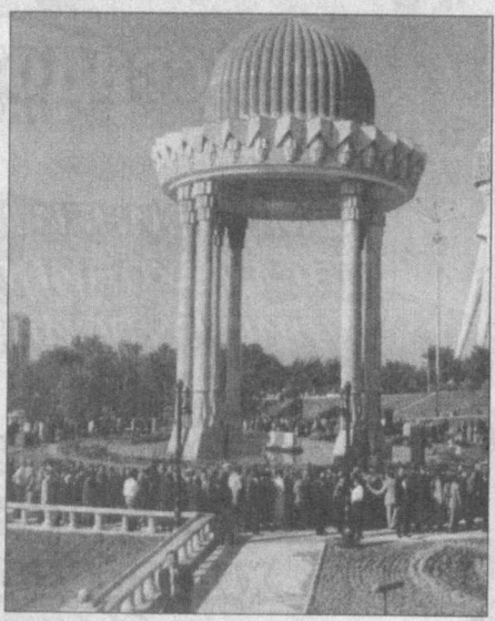
Менгаш мумкин ўшал кимсага — абгор Истибод жабричи чеккан Ватанини.

Кўрганмисиз — қадрин унутган, ҳоксор, Тили қисик, бўйни эгик одамни?