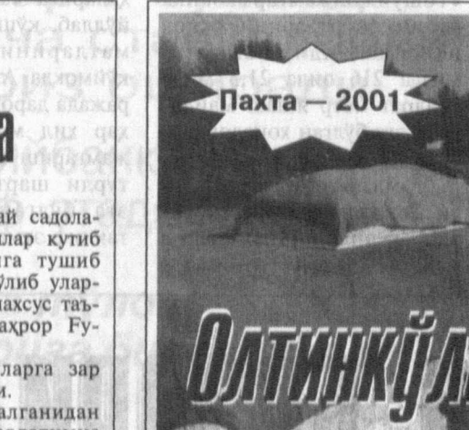
Пахта — 2001

Нукусда "Нодавлат нотижорат ташкилотларини ҳўқуқий тартибға солиш" манзулида семинар бўлиб ўтди. У Нотижорат ҳўқуқ халқро маркази томонидан Ўзбекистон Республикаси Олий Мажлисининг демократик институтлар, нодавлат ташкилотлар ва фуқароларнинг ўзини ўзи бошқариш органлари қўмитаси ва Инсон ҳўқуқлари миллий маркази қўмитаси ташкил этилди. Семинарда айтилган бошқармалари, ҳокимликлар, солиқ хизмати, Қорақалпоқiston Республикаси ва Хоразм вилоятининг бошқа тузилмалари вакиллари ҳамда нотижорат ҳўқуқ соҳасида ишлайдиган хорижлик мутахассислар иштирок этди. Семинар қатнашчилари етакчи мутахассисларнинг маърузаларини муҳокама қилди, нодавлат нотижорат ташкилотлари фаолиятининг ўзини хос жиҳатлари билан боғлиқ саволларға экспертлар жавобларини олди. А. ОРТИҚБЕВ, ЎзА муҳбири.