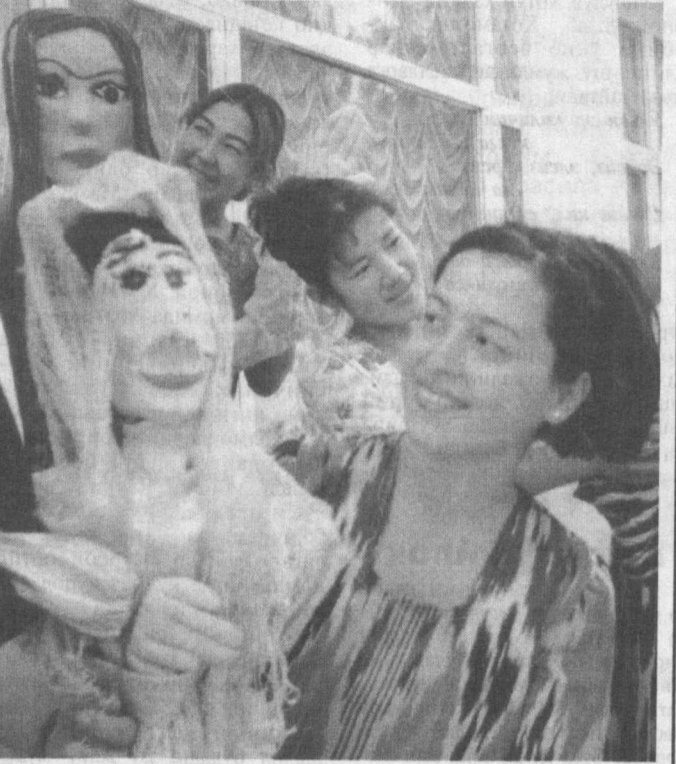
СУРАТЛАРДА: вилоят кўғирчоқ театри болониси; Термиз шаҳар маданият ва санъат коллежи талабаларининг «Зумрад ва Қиммат» эртани асосидagi кўғирчоқ театрини тайёрлаш жараёни ака эътирилган.

Инсон умрининг энг шодон, энг қувноқ ва салимий даври болалигидир. Агар сиз энг беғубор онларингизни соғинсангиз Термиз шаҳридаги маданият ва санъат коллежи талабалари тайёрлаган кўшиқлари томошаларни кўринг. ... Меҳнаткаш ва оқила Зумрад, дангаса ва танбал Қиммат, чол-кампир... Уларнинг барчаси Сизни олис болалигингиз сари етаклайди. Эртак қаҳрамонлари ижрочилари эса мазкур билим юрти талабаларидир.