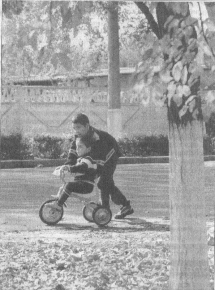
Кузнинг сокин кўчаларида Кезайтган болаҳкам — баҳор...

Бердимат хоҳоланин бошлаган чўғда, студиядаги микрорфон «ишқ» этиб ўчиб,