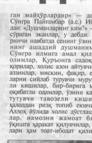
Уларнинг бунда қандай сир бор?

Табиийки, ҳар бир мусулмон — мўмин одам муборак Рамазон ойини ўзига хос изат ва эҳтиром билан кутиб олиб, уни яна ўзига муносиб равишда кузатиб қўйишга имкони борича ҳаракат қилади.