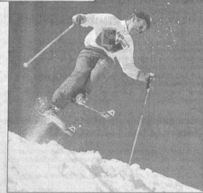
● Олимпиада шаҳарчасида 3500 нафар спортчи, мураббий ва расмий кишилар истиқомат қилади. Уларга Юта штати университетининг ётоқхоналари тақдим этилган. Бу ерга бегоналар кириши мумкин эмас.