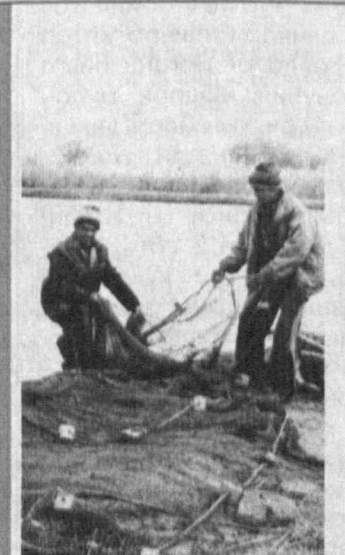
Етти хазинанинг бири

● Оролбўйидаги нуфузли олий ўқув юртидан бири — Нукус давлат педагогика институтига 4,5 минг таълим олувчи талаба 19 ихтисослик бўйича тахсил кўрмоқда. Улар яқинда қурувчилардан ажойиб соғва олишди. Миллий ва замонавий меъморчилик анъаналари асосида қайта таъмирланган ўқув-тарбия мажмуининг биринчи навбати фойдаланишга топширилди. Бунинг учун 88 миллион сўм маблағ сарфланди. Бунёдкорлик ишлари «Оролбўйиқуриш» акциядорлик жамияти меҳнат ҳақи томонидан олиб борилмади. Бош лойиҳада янги ўқув корпуси, спорт зали маъмурият биносини барпо этиш ҳам кўзда тутилган.