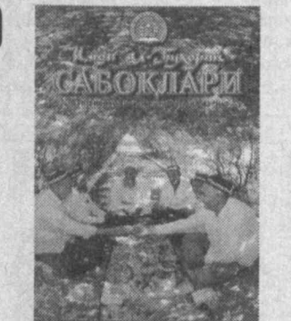
Сабуқтегиннинг Фазнадаги ҳуқуқий даврига оид парча берилган...