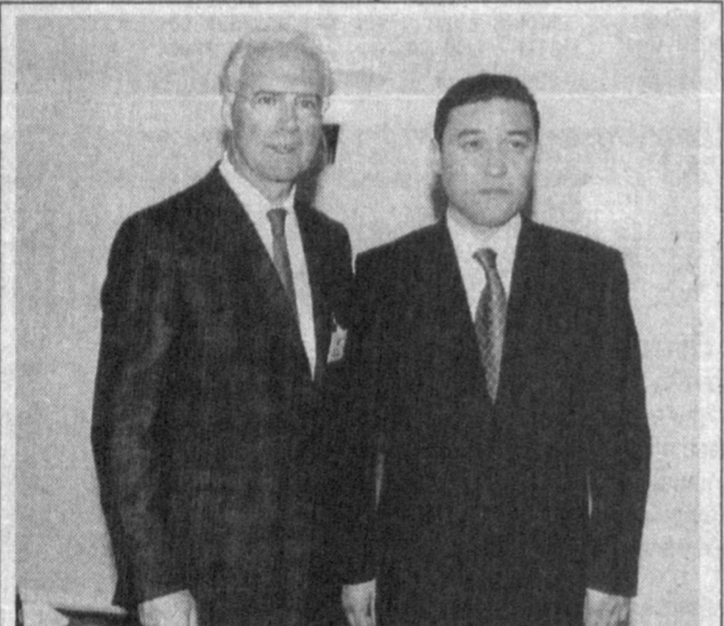
Ф. Беккенбауэр ва Б. Раҳимов. Ҳам футболчи, ҳам мураббий сифатида дунёга танилган Франк ака "Немис машинаси"нинг сирини ўзбек футболчи ривож учун очган бўлса, не ажаб!