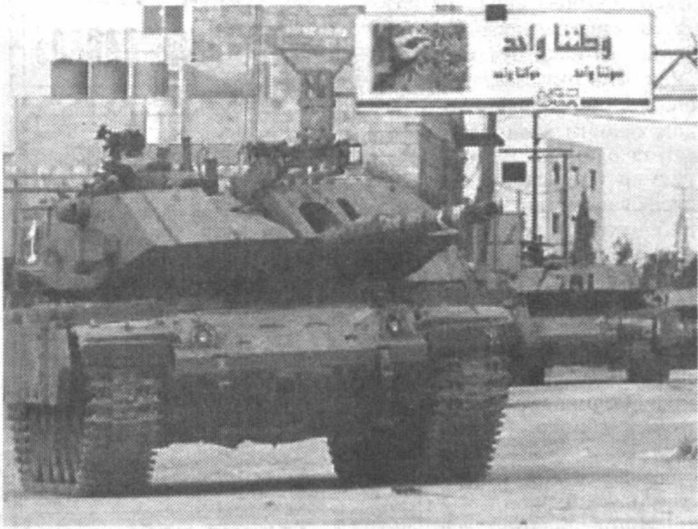
Исроил ҳарбий кўмондонлиги кечадан бошлаб Газа сектори ва Иордан дарёсининг гарбий қирғоғида