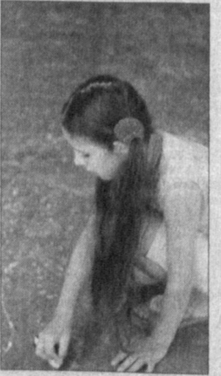
СУРАТЛАРДА: кўрик-танлов иштирокчилари акс эттирилган.