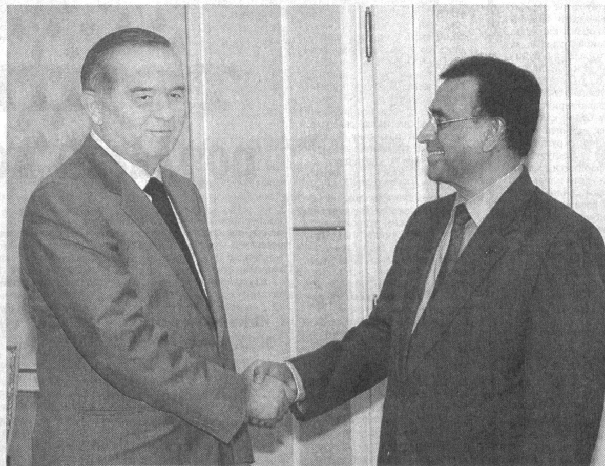
СУРАТДА: қабул пайти.

шу масала сўхбатнинг бош мавзуси бўлди. — Биз сизни нафақат БМТ Бош котибининг ўринбосари, балки ядровий қуролидан холи зона бўйича йирик мутахассис сифатида ҳам ҳурмат қиламиз, — деди давлатимиз раҳбари меҳмонни юртимизга ташрифи билан қўтарди. — Минтақамизда хавфсизлиги ва барқарорлигини мустақамлаш йўлида БМТ томонидан амалга оширилаётган барча сайёҳаркатларни Ўзбекистон ҳукумати юқори баҳолайди. Айтиш керакки, Ўзбекистон билан БМТ, шунингдек, унинг ҳузуридаги турли соҳаларда фаолият кўрсатувчи барча ташкилотлар ўртасида ишончли ҳамкорлик алоқалари ўрнатилган. Бу ишонч келгуси ҳамкорлигимиз янада самарали бўлишига замин яратмоқда. Меҳмон самимий қабул учун миннатдорлик билдирар экан, БМТ Ўзбекистоннинг тинчликпарварлик сиёсатини юқори баҳолаши ва кенг қўллаб-қувватлашини таъкидлади. Сўхбат чоғида халқаро майдонда ва Марказий Осиёда ядровий қуролидан холи зонага айлантириш йўлида амалга ошириётган ишлар, минтақамиздаги вазият, Афғонистондаги тикланиш тadbирлари, террорчиликка қарши кураш ва бошқа қатор масалалар ҳусусида фикр алмашилди.