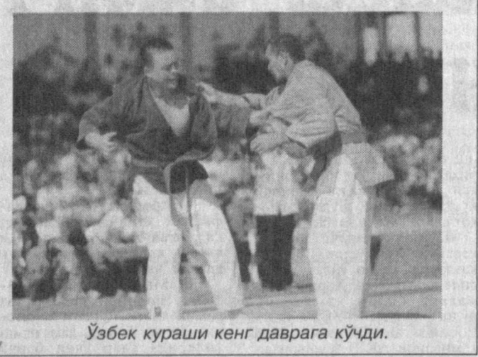
Ўзбек кураши кенг даврага кўчди.

Сирдарёлик полвоннинг гаплари мени ўйлантириб қўйди. Наҳотки шу кичкинагина Попа шунча полвонлар бўлса. Уларни ҳатто сирдарёликлар ҳам таниб, номлари-гача билдишса-ю, шу ердаги-лар — биз ўзимиз яхши бил-масак. Мен сирдарёликлар мураб-бийсининг ҳурмат-эътибори-ни қозонган «Тўппонча пол-вон»ни излай-излай «Деҳқон бозори»даги мўъжазгина ош-