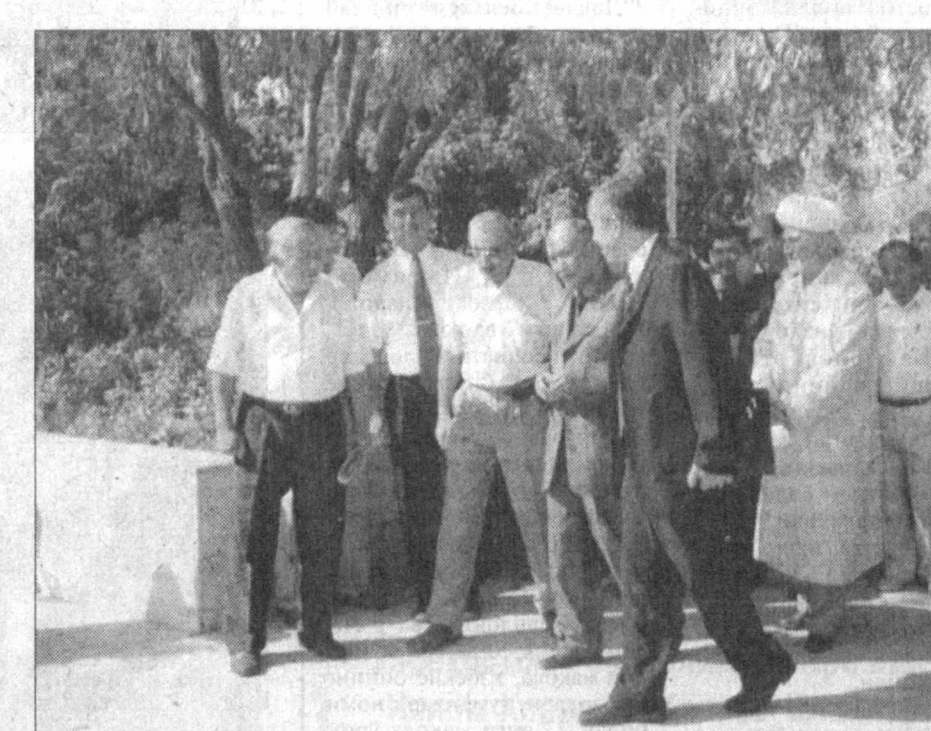
Гўзал ва бетакорр Навоий вилоятида Ватанимиз мустақиллигининг 11 йиллигига бағишланган «Ўзбекистон — умумий уйимиз» дўстлик фестивали бўлиб ўтди. Республика байналмилал маданият маркази, республика «Мавна- вият ва маърифат» маркази ва Навоий вилояти ҳокимлиги ҳам- корлигида ўтказилган мазкур ан- жуман кўпчиликни оқиниша са- зовор бўлди. Фестиваль очилиши- да сўзга чиққан вилоят ҳокими Баҳриддин Рўзиев, Республика бай- налмилал маданият маркази ди- ректори Карим Расулов ва бошқа- лар қароқилди, биродарлик байрами иштирокчиларини табриқладилар. Атоқли шоиримиз, Ўзбекистон Қа- рамони Абдулла Орипов таълиқни эъзозлаш, унинг қадрига етиш, му- стаҳкамлашда юртимизда яшаётган барча миллат вакиллари билан биргисини ўзининг дил сўзла- ри ва шеърлари билан ифода этди.

Вилоят ҳокимлигида ўтказилган «Миллий гоя — бизнинг гоя» мавзусидаги конференция, вилоят-