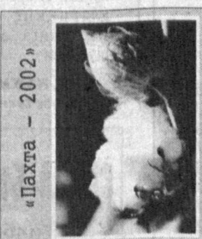
«Пахта - 2002»

кўжалиги, масалан, етиштири- ган икки миң тоннадан кўпроқ пахтасининг ярмини 3-ун миллион сўм миқдориде зар- ра кўрди. Шурчи туманидаги А.Сафаров номи энг пешқа- дам, деб ҳисобланган ширкат ҳужалиги эҳтимол биз юқори- да бейн этган ҳолатлар боиси- данлар соҳадан қўзланган да- ромад фойдани оломай ту- рибди. Бу эса жойларда деҳ- қоннинг, пахтакорнинг қачон қосаси оқаради, деган сўро-