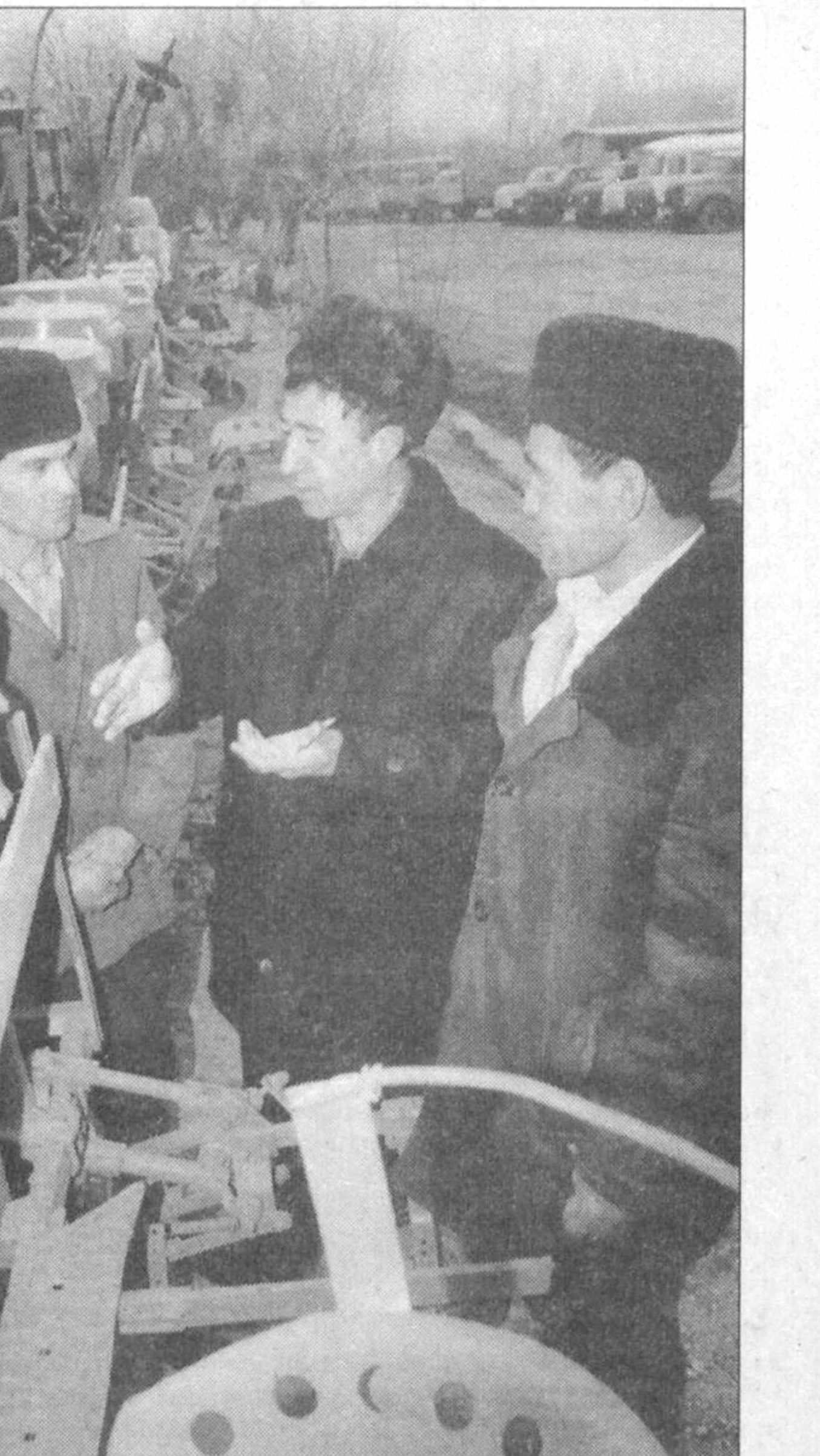
Қиш фасли ҳам оёқлаб қолди. Шу боис ҳам Навбахор туманидаги «Янгиқўрғон» ширкат хўжалигида баҳорги экин мавсумига пухта ҳозирлик кўриляпти. Жорий йилда хўжаликда 597 гектар майдонда пахта, 283 гектар ерда галла парваришланади. Айти кунларда бу ерда ариқ-зовулар тозаланмоқда. Мавжуд техника воситалари эса баҳорги экин мавсумига тахт қилиб қўйилди.

«Умид» жамғармаси ўтган йили 39 та грант совиндорларини хориқ юрталарга юборган бўлса, бу йил уларнинг сони 300 га етди. Мақсад бу кўрсаткичларни ошириш эмас. Тажрибадан аёнки, ўқувчилар сонини ошириш билан муддаога этиб бўлмайди. Айтилик, Малайзия биздагидек олий таълим тизимига эга бўлмасдан туриб, топган маблагни жамлаб, ўн минглаб, йигирма минглаб ёшларни ўзга давлатларга таълим олгани жўнатиб турди. Бизда эса йиллар давомида шаклланаётган олий таълим тизими бор. Биз жаҳоннинг энг нуфузли дорилфунунларини ўз юртимизга жалб этсак, бу йил ўша ерда таълим олиб қайтандан кўра арзон ва қулай. Буюк Британиянинг Халқаро Вестминстер университети ана шу йўлдаги биринчи ютук, Нима учун ютук? Чунки