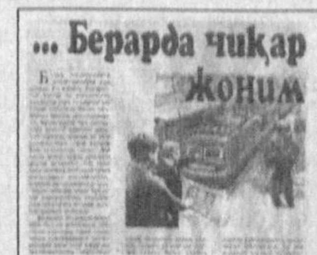
...Берарда чиқар ЖОНИМ

Газетамизнинг шу йил 10 январь сонида «Берарда чи- қар жоним» сарлавҳали ма- қола чоп этилганди. Унда «Ўзбекистон темир йўллари» давлат акциядорлик компа- ниясига қарашли баъзи кор- хоналарда иш ҳақи ўз вақ- тида берилмаётганлиги, де- биторлик ва кредиторлик