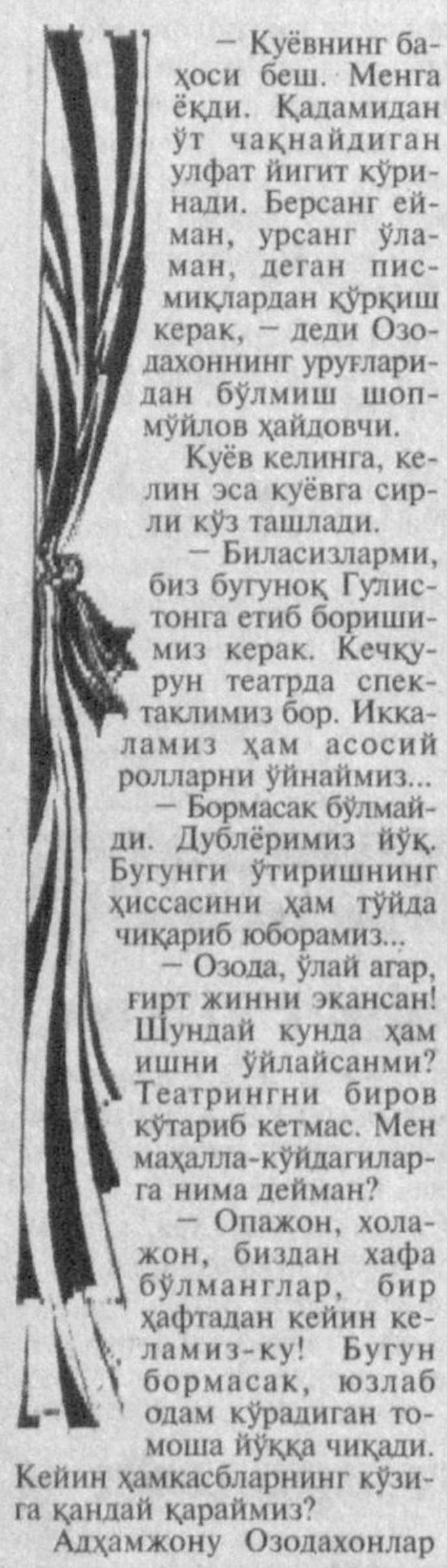
Кейин ҳамкасбларнинг кўзига қандай қараймиз? Адхамжону Озодаҳонлар