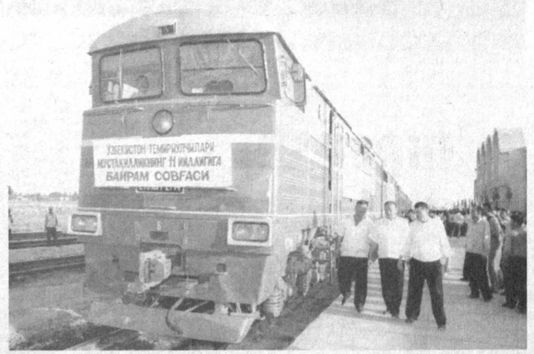
Ушбу поезд 2001 йил 23 март куни ишга туширилди. Унда биринчи юк поезде қатнови йўлга қўйилди. Жорий йилимизнинг 22 август куни эса бу йўлда биринчи йўловчи поезде ҳаракатлана бошлади. 254-рақамли ушбу поезд мустақил Ўзбекистонимиз солномасига кичик, аммо ёрқин бир тарих бўлиб кирди.

Демак, бу йўл тўғрисида адиблар, журналистлар ҳали кўп ёзадилар. Бу йўл кино ва бошқа хил санъат асарларига бош мавзу бўлади. Унинг келажаги олдинда.