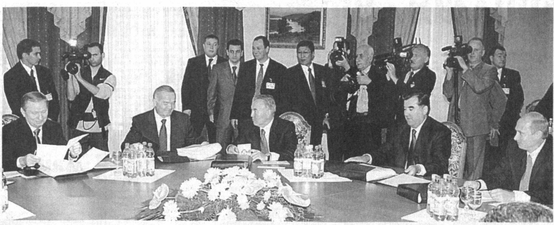
Давлатимиз раҳбарининг Кишинёвда ташрифи Молдова Президенти Владимир Воронин билан учрашувдан бошланди. Учрашувда Ўзбекистон билан Молдова ўртасидаги муносабатларнинг бугунги аҳволи ва истиқбол, мамлакатларимиз ўртасидаги ҳамкорлик алоқаларини янада кенгайтириш билан боғлиқ масалалар юзасидан фикр алмашилди.

Шу йилнинг 6-7 октябр кунлари Молдова пойтахти Кишинёвда Мустақил Давлатлар Ҳамкорлиги аъзо мамлакатлар давлат раҳбарларининг учрашуви бўлиб ўтди. Унда Ўзбекистон Республикаси Президенти Ислам Каримов иштирок этди.