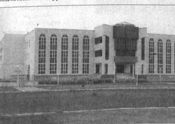
СУРАТЛАРДА: ўқитувчи Аъзамжон Мусаев машғулот ўтатиши; коллеж бизнесининг умумий қўрилиши.

Қишлоқда қурувчио дуралгорнинг ошиғи олчи. «Хунарли хор бўлмас» деган мақол айнан ана шу соҳа кишиларига айтилгандай. Негаки, ёшларнинг улғайиши, янги оилаларнинг бунёд бўлиши янги уй-жойлар қуришга эҳтиёж туғдиради.