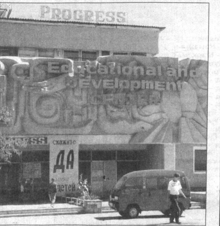
Нукус шаҳрида "Прогресс" таълим ва ривожланиш маркази ташкил этилганига ўн йил тўлди. Дастлаб саноклигинга ёшлар билан иш бошлаган марказда, бугунги кунга келиб 1130 ўқувчи хорижий тилларни ўрганаётир. Эъти-борли томони шундаки, машғулотларни асо-сан хорижлик мутахассислар олиб борадилар.