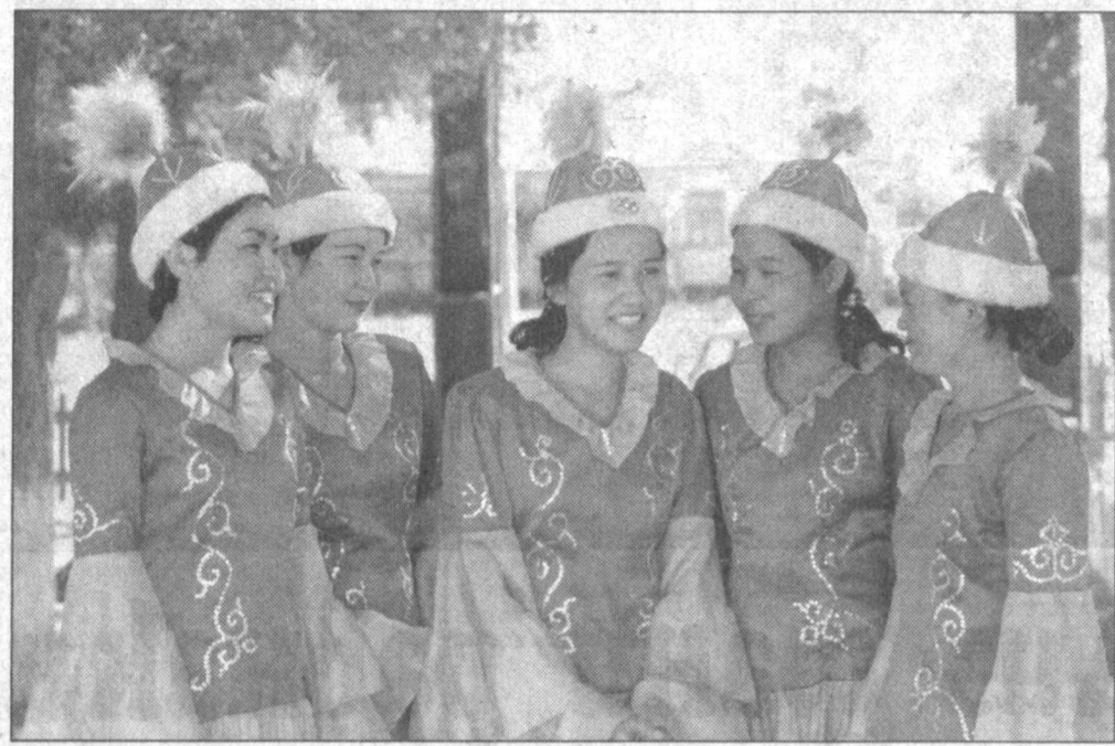
Конишх туманидаги "Сарибел" номи ширкат ҳўжалигида "Сарибел сазы" фольклор ансамблининг ташкил этилгани хали кўп вақт бўлганича йўқ. Шу қўрса вақт мобайнида ансамбль ўз мукисларига эга бўлиб улгурди. Яқинда у вилот миқёсида ўтказилган "Ўзбекистон — Ватаним менин" танловида I-ўринни эгаллаб, республика босқичига йўланма олди. СУРАТДА: "Сарибел сазы" ансамбли аъзолари.