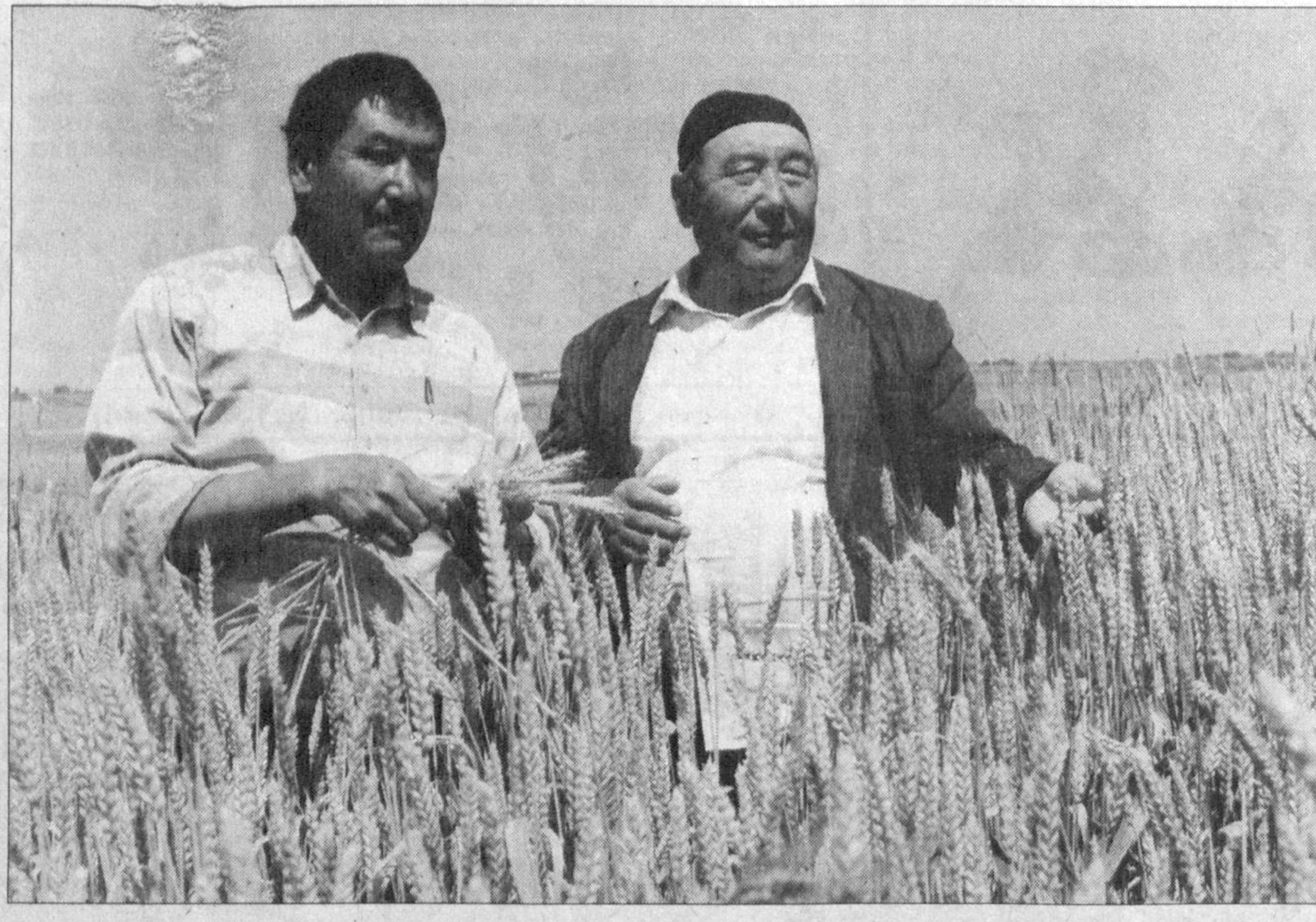
Чиноз туманидаги «Эшонобод» ширкат хўжалигида ҳам галла ўрми-йғини қизғин давом этмоқда. Бутун иш кучи, техника воситалари мавжуд 420 гектарда етиштирилган ҳосилни нест-нобуд қилмасдан йиғиштириб олишга қаратилган.

Фаргона туманидаги касб-хунар коллежларида бўлиб ўтган тадбирлар «Хавфсизлик, ижтимоий-сиёсий барқарорлик — мамлакат ва жамиятнинг мустақил демократик ривожланиш шарт».