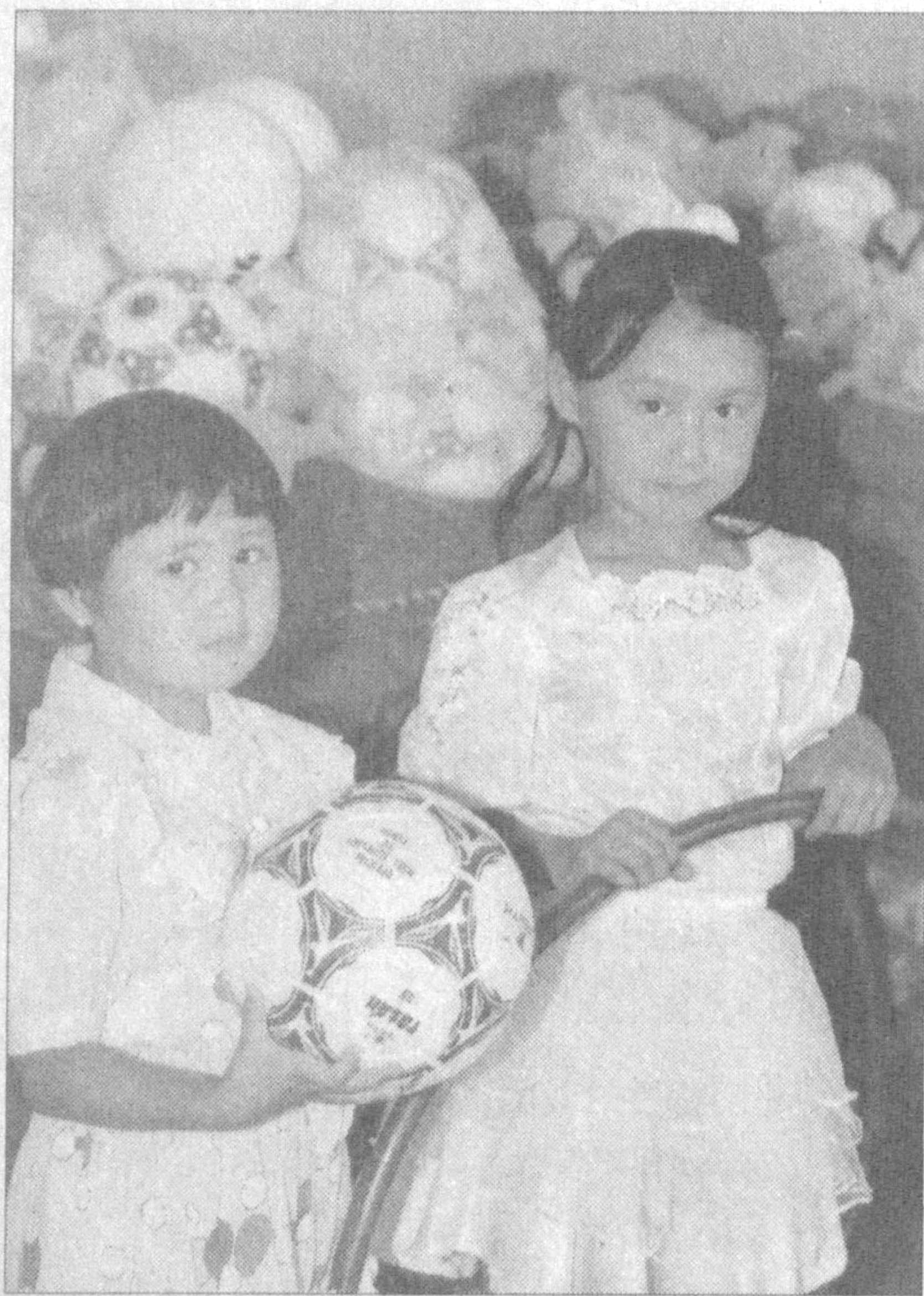
Ёш авлоднинг жисмоний чиққитириши, камолга етказиш Болалар спортини ривожлантириш жамғармаси дастурининг бош йўналишларидан бири ҳисобланади. Афсуски, кўпгина жойларда спорт анжомлари етишмайдими. Бу эса бошланган хайрли иш равақига соя солади.

Болалар спортини ривожлантириш жамғармасининг Тошкент вилояти бўлими бу соҳада ибратли ишларни амалга оширмоқда. Кунни кеча вилоят бўлими мутахассислари Бўстонлиқ туманида бўлиб, болаларга 8 миллион сўмлик спорт жиҳозлари ҳая элди.