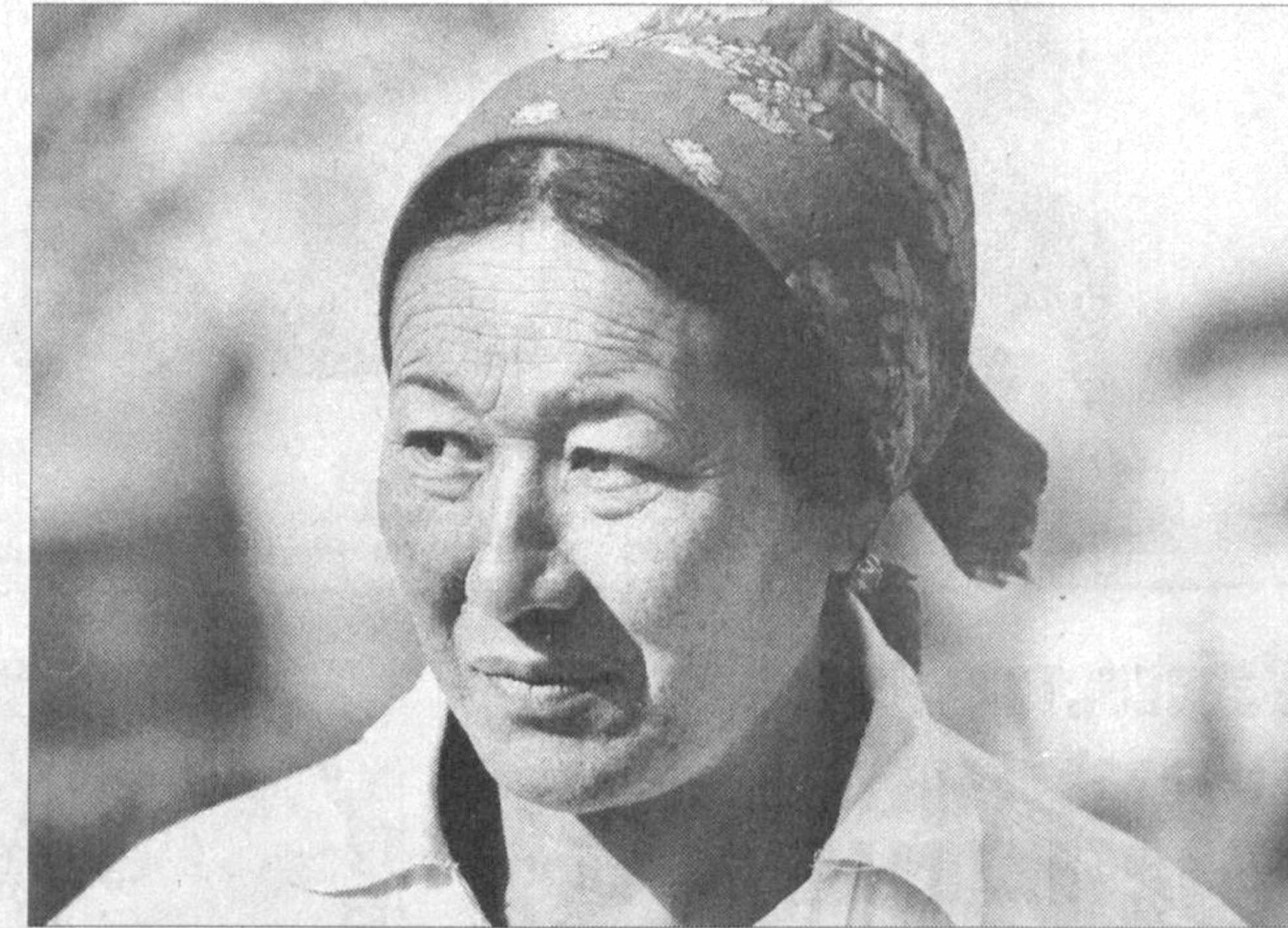
Шахрисабз туманидаги Амир Темур номи ширкат хўжалигининг 2-фермасида 310 бош қорамол парвариши қилинапти. Уларнинг 100 боши соғин сизир қилади.

Олий Мажлиснинг яқинда бўлиб ўтган XI сессияси, Президентимизнинг сессияда сўзлаган маърузалари одамларимиз шурида, қундалик ҳаётда шакллари ижобий ўзгаришларга, уларнинг ўз келажакларини идрок этишга боғлиқ орзу-интилишларига янгица маъно-мазмун бахш этётганини яна бир бор таъкидлаш бақамтидигимизни, аҳиллигимизни, умуммақсад йўлида бир ёқдан бош чиқариб ишлаётганимизни ҳис этиш, ишончимизга ишонча, кучимизга куч қўймоқда.