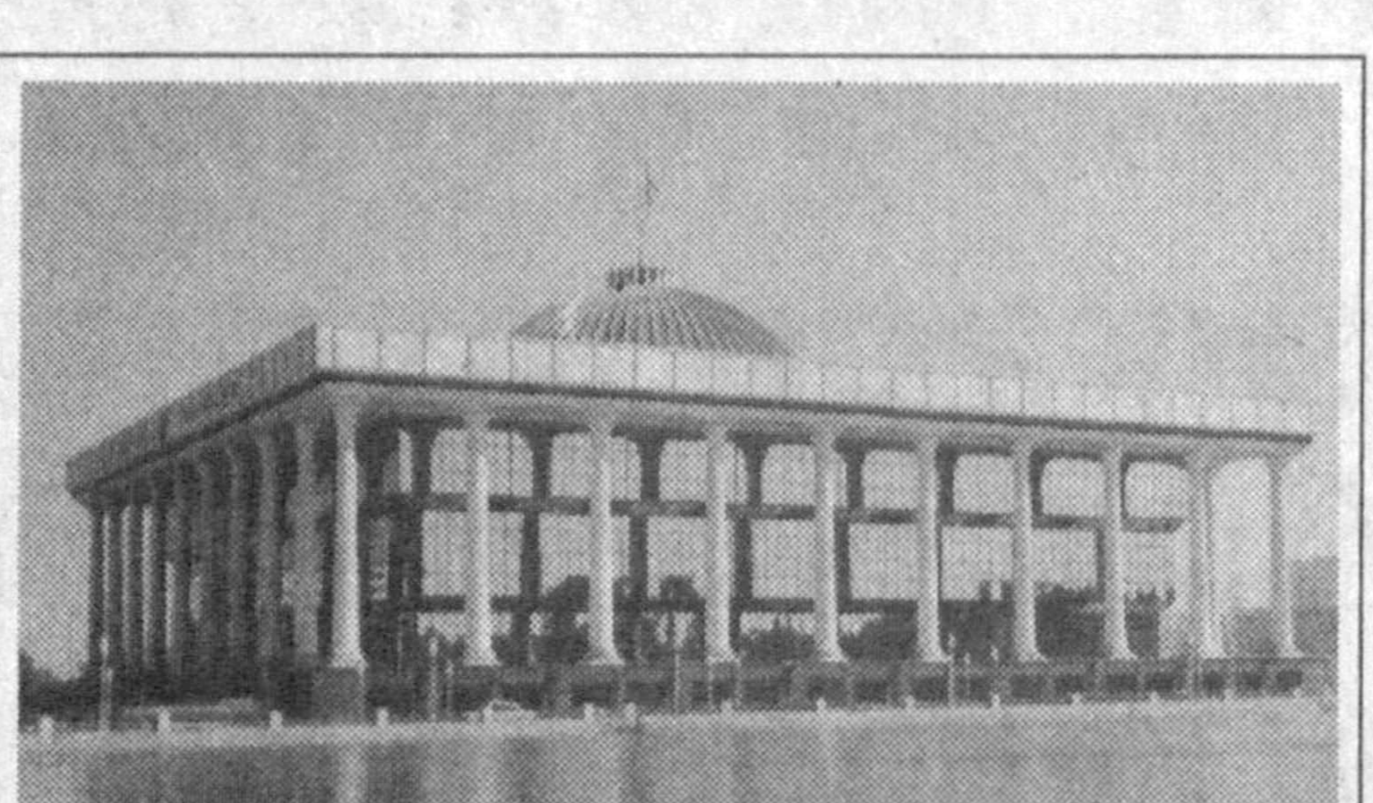
Сиз сессиядан нимани кулаяпсиз?