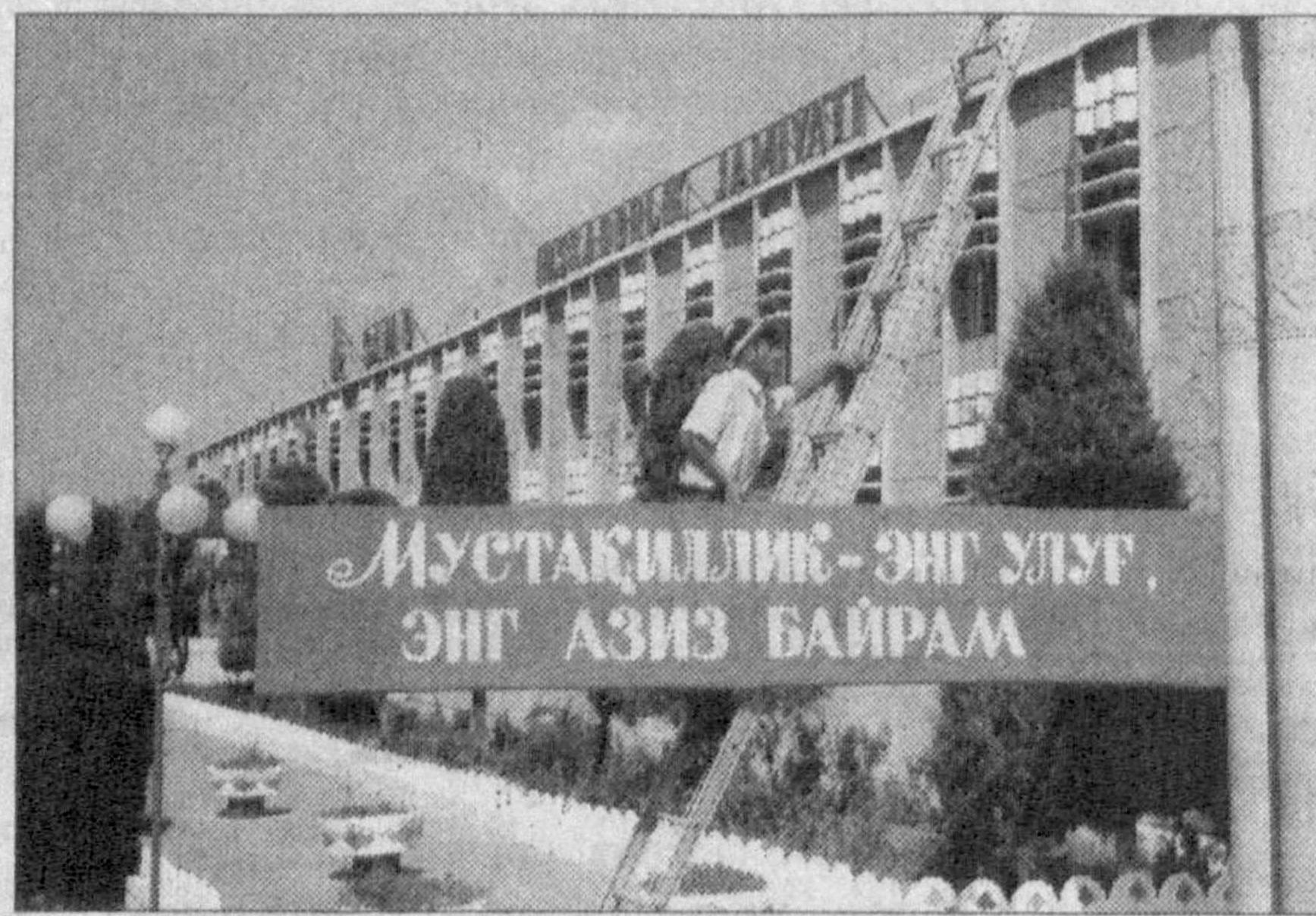
Балиқчи ҳақида сўз кетса, аввало туманининг кўзга кўринган ишоотлари, меҳнатни шараф деб, билувчи аҳолиси ҳақида ҳурмат билан гапирилади. Шунингдек, бу ердаги узоқ тарихдан сўзлагуви тарихий обидаларга ҳам алоҳида урғу берилади. Шулардан бири Учбулоқ зияратгоҳидир. Узоқ йиллар ташландик ҳолда ётган ушбу қадимки мустақиллик йиллари ўзича чирой касб этди. Қайта таъмирлашиб, боғу гулзорга айлантирилди.

Жумладан, томошабинлар Асака автомобил заводининг янги маҳсулотлари — «Ласетти» автомобили ҳамда «Матиз»нинг такомиллаштирилган моделини, шунингдек, «Файз», «Совластатил» каби йирик корхоналарда ишлаб чиқарилган янги маҳсулотларни томоша қилиши мумкин.