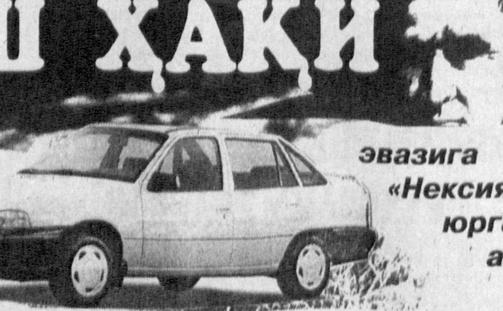
эвазига «Нексия» минибу юрганларнинг аҳволи вой бўлди

боев ва А. Навоий номи ширкат ҳўжаликларида ҳам худди шундай қонунобузишлари содир бўлди. Ушбу ҳўжаликларнинг ҳам иш ҳақи ва бошқа тўловлардан қарзлари мав-жуд бўлгани ҳолда ҳўжаликнинг мансабдор шахслари ўз ваколатлари-нинг сунгистемол қилинган. Оқибатда Й. Охунбобоев номи ширкат ҳўжалигида 2002 йилги гал-ла траншилдан 7 миллион сўми «Ман-тиз», А. Навоий номи ширкат ҳўжалигида эса 7,5 миллион сўми «Тик» автомашинаси сотиб олиш учун қонунсиз ишлатиб юборилган. Вақодинки, ушбу ҳўжаликларда хиз-матда фойдаланиш учун автомаши-налари мавжуд эди.