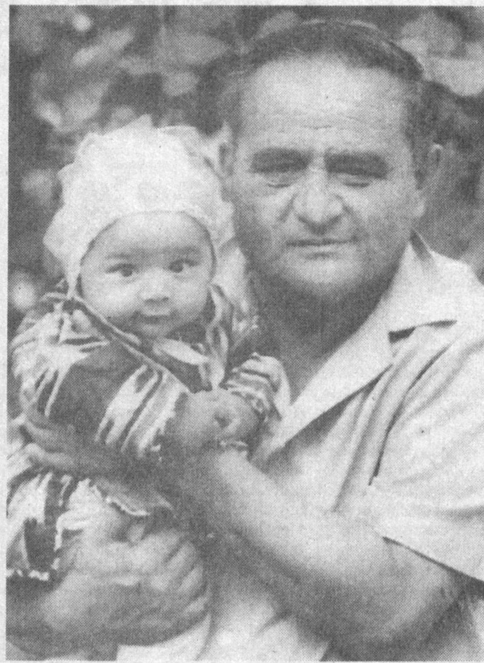
Кенг йўллар авжига сиз содиқ қолинг, Нопок қадамларга топтамалар бироқ.

Уфқлар қадарли кетинг, мавж олинг, Серқатнов сўқмоқлар мудом суяқроқ.