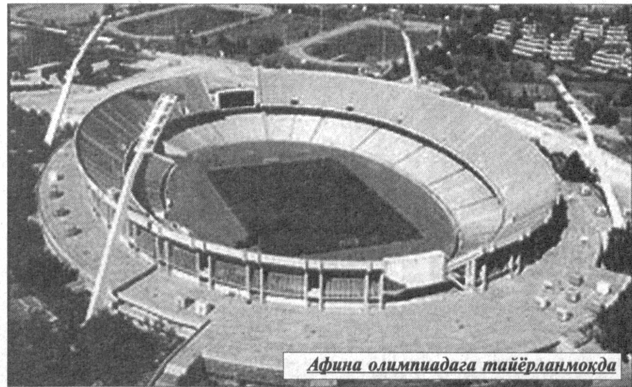
Афина олимпиадага тайёрланмоқда