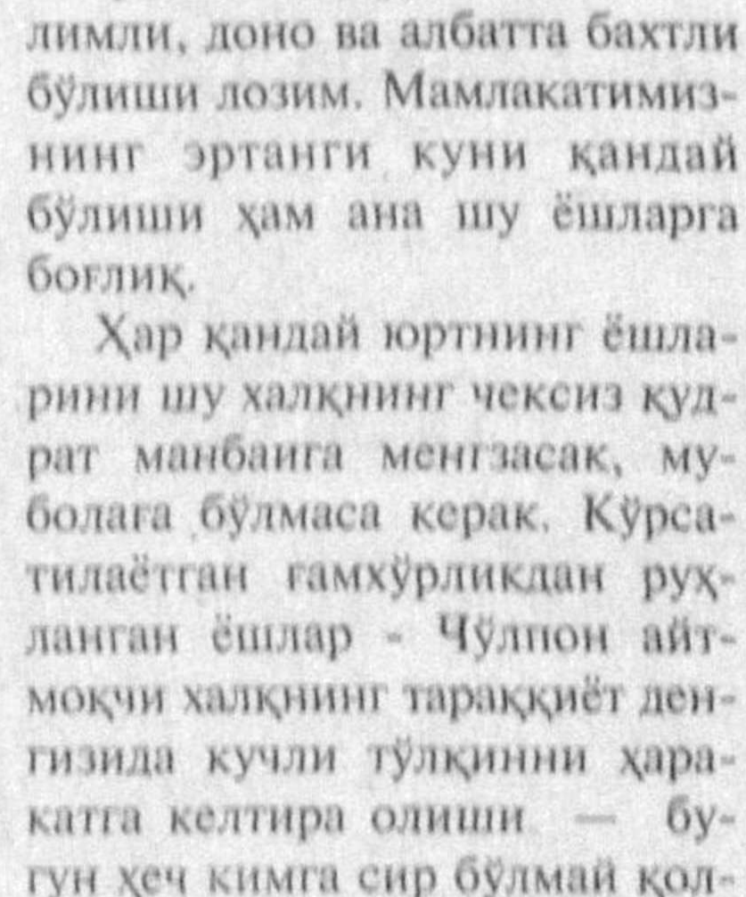
“Оз-оз ўрганиб доно бўлу”

“Қўлингизга яқингинада “Ижод дунёси” нашриёт уйининг компьютер бўлимида тайёрланган “Оз-оз ўрганиб доно бўлу” рисоласини тушган бўлса, билингки, сиз яхши бир суҳбатдош топсансиз. Бунинг боиси бор. Гап шундаки, ҳамкасбларимиз — “Тошкент оқшом” маъмуриятининг ижодкорлари сая-ҳаракати билан маъмур газета саҳифаларида мунтазам бериб бориладиган ҳикматли суҳлар, донолар бисотида олинган дурдоналар, дидактик руҳдаги ҳикоя ва ривоятлар тўплами, жажжи рисола тайёрланди.