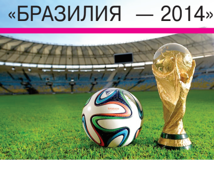
«БРАЗИЛИЯ — 2014»

Жорий йил Бразилияда ўтказиладиган футбол бўйича жаҳон чемпионати учун чиқарилган чипталарнинг учдан икки қисми 15 апрель кунига қадар сотиб бўлинган.