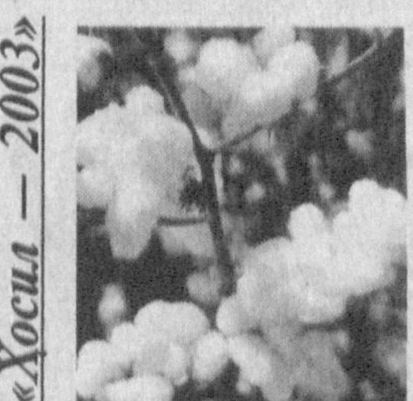
«Ҳосил — 2003»

Бугун мамлакатимизнинг қай бир гўшасига борманг, қалб кўри, пешона тери эвазига етиштирилган пахта ҳосилини нобуд қилмай териб олишга бел боғлаган пахтакорларга, уларга баҳоли қудрат ёрдам бераётган хашарчиларга кўзингиз тушсун. Уларнинг ҳаракатлари, шиддатига ҳавас билан боқасиз. Мақсад — етиштирилган мўл ҳосилни ёғин-сочинли қулларга қолдирмай саранжомлаб олиш.