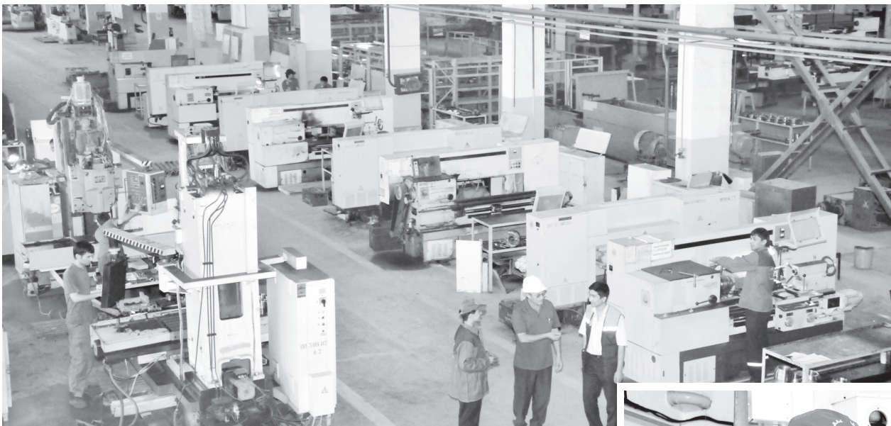
(Давоми. Бошланғичи 1-бетда).