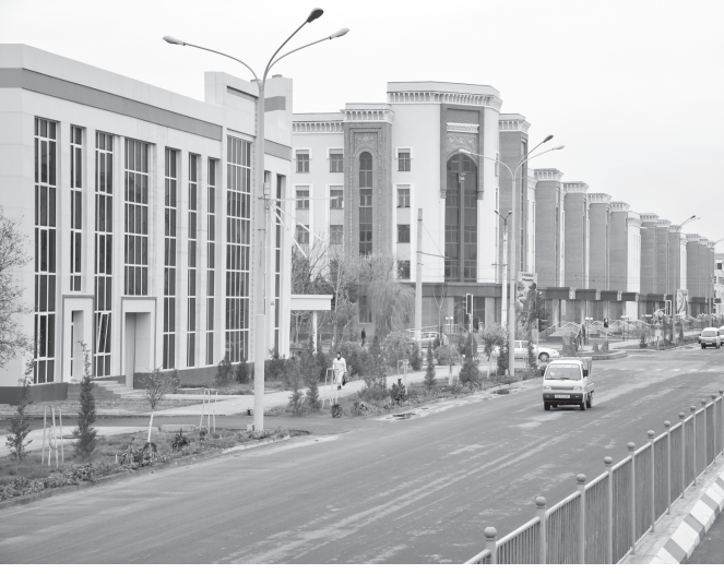
(Давоми. Бошланғичи 1-бетда).

Юртимизда бўлган хорижлик сайёҳлар халқимиз ҳақида ана шундай фикр билдиришмоқда.