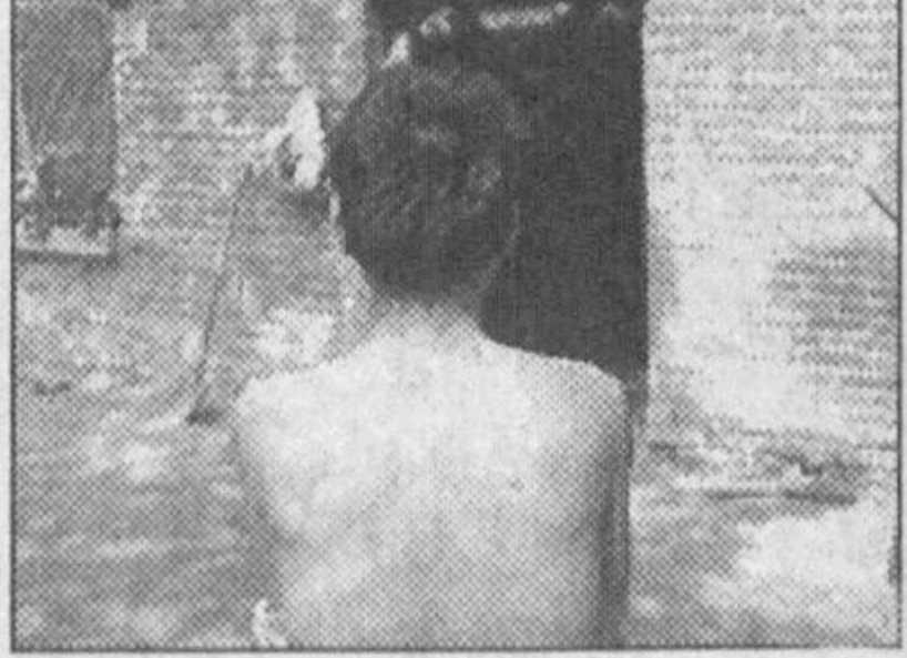
неча баробар ёмонроқ.

АҚШнинг собиқ президенти Билл Клинтон Пекинда ОИТС ва гайрооддий зотилхалқга қарши кураш бўйича ўтказилаётган халқаро конференцияда сўзга чиқди.