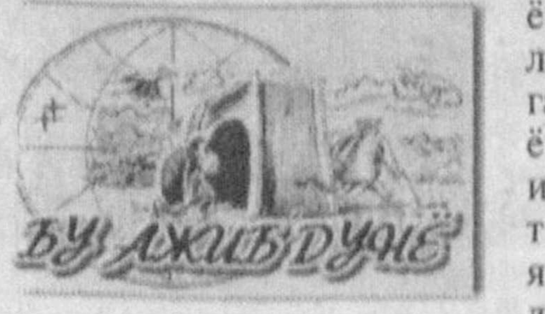
БУ АЖИБ ДУНИЯ

Бу воқеа Австралининг Дарвин шаҳридан 400 километр узоқликдаги қўлда бўй берди.