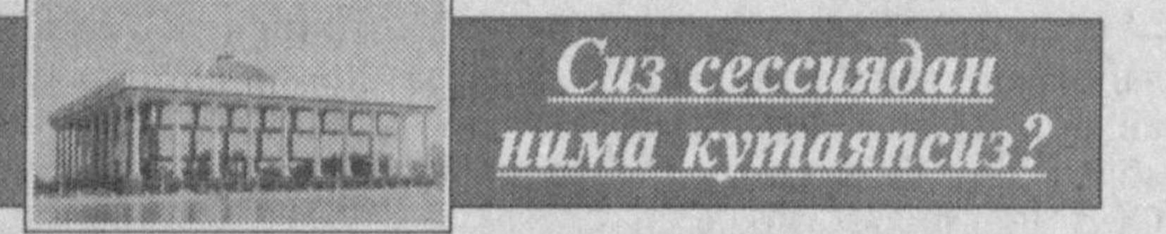
Сиз сессиядан шима кутаясиз?

Олий Мажлисининг XIII сессияси кун тартиби эълон қилинди. Унда муҳокамага қўйилган масалалар ҳаётимизнинг турли соҳаларини қамраганини кўриш мумкин. "Хусусий корхона тўғрисида"ги Ўзбекистон Республикаси Қонуни лойиҳаси (иккинчи ўқиш), "Аҳборотлаштириш тўғрисида"ги Ўзбекистон Республикаси Қонуни лойиҳаси (иккинчи ўқиш) ва "Муҳофаза чоралари, антидемпинг ва компенсация божлари тўғрисида"ги Ўзбекистон Республикаси Қонуни лойиҳаси (иккинчи ўқиш) долзарб ва зарурлиги жиҳатидан бири-бирдан қолишмайди. Куйида юрдошларимизнинг баъзи қонуний ҳолатлари хусусидаги мулоҳазалари билан танишасиз.