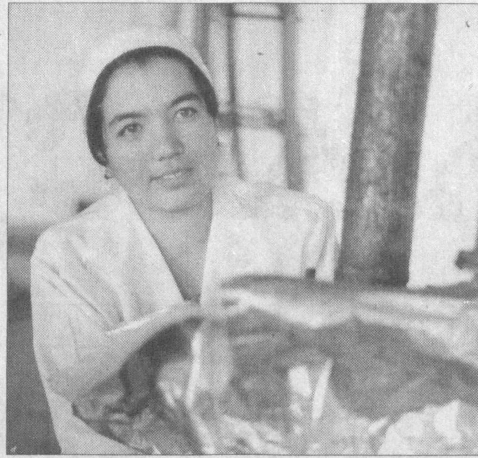
Ўзбекистон Республикаси Конституциясининг 11 йиллигига