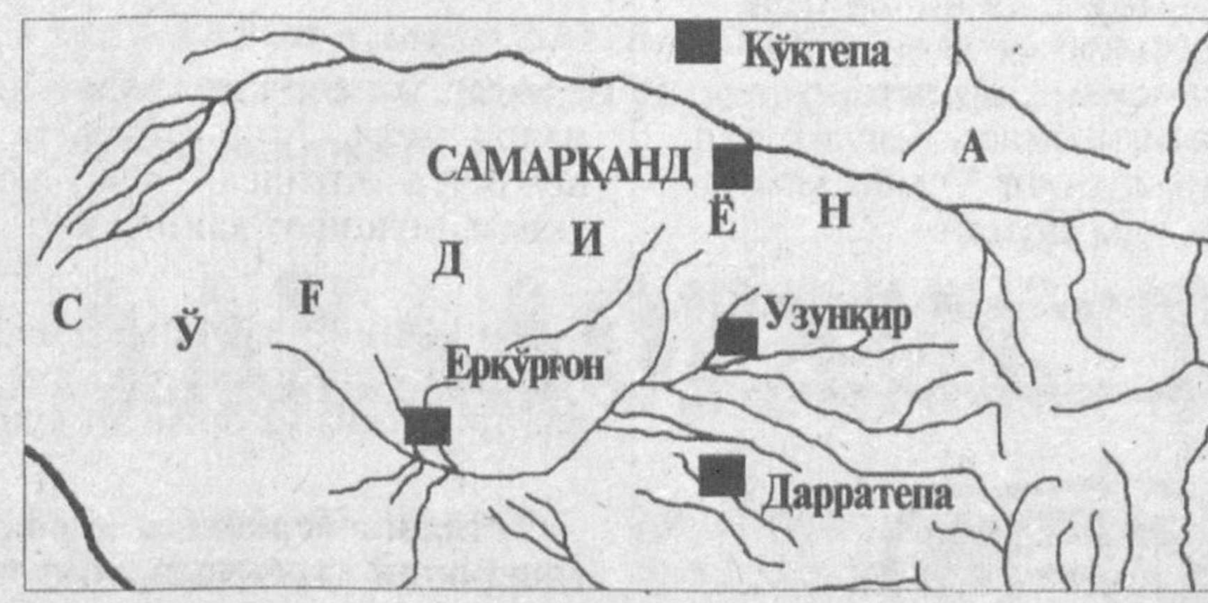
СУРАТДА: милоддан аввалги IX-VII асрларда Сўлд ҳудуддаги қадимги шаҳарлар.

Натижадан ер сатҳидан 10-15 метр чуқурликда жойлашган қатламлардан милоддан аввалги IX-VII аср ўрталарида оид ашёлар топилди. Бу, биринчидан, қўлда ясалган рангли нақшда сопол идишларнинг парчалари бўлса, иккинчидан, гуваладан ясалган, қалинлиги 7 метр келадиган мудофаа девори қолдиқларининг топилди.