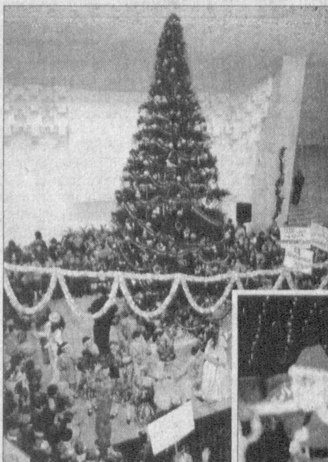
СУРАТЛАРДА: "Президент арчаси" тантаналаридан лавҳалар.

арчаси" тантанасида яна бир бор англаб етдик. Пойтахтимиздаги меҳрибонлик уйлари болажонлари дастлаб безатилган улкан арча атрофида Қорбобо ва Қорқиз иштирокида шўҳ рақслар, дилбар кўшиқлар ижро этилди. Болалар учун махсус тайёрланган "Мен! Сен! Биз! Дунё кезамиз!" мусиқали спектакли кичиктойларга яна бир ажойиб тўхфа бўлди. Дўстлик, ахиллик, юртга садоқат, ватанпарварлик гояларини тараннум этувчи бу эртанки болалар зўр кизиқиш билан томоша қилди.