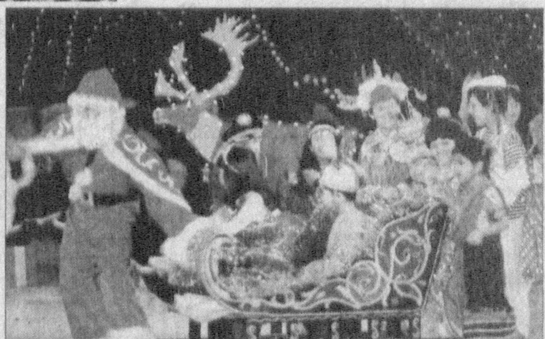
Рашид ГАЛИЕВ олган суратлар.