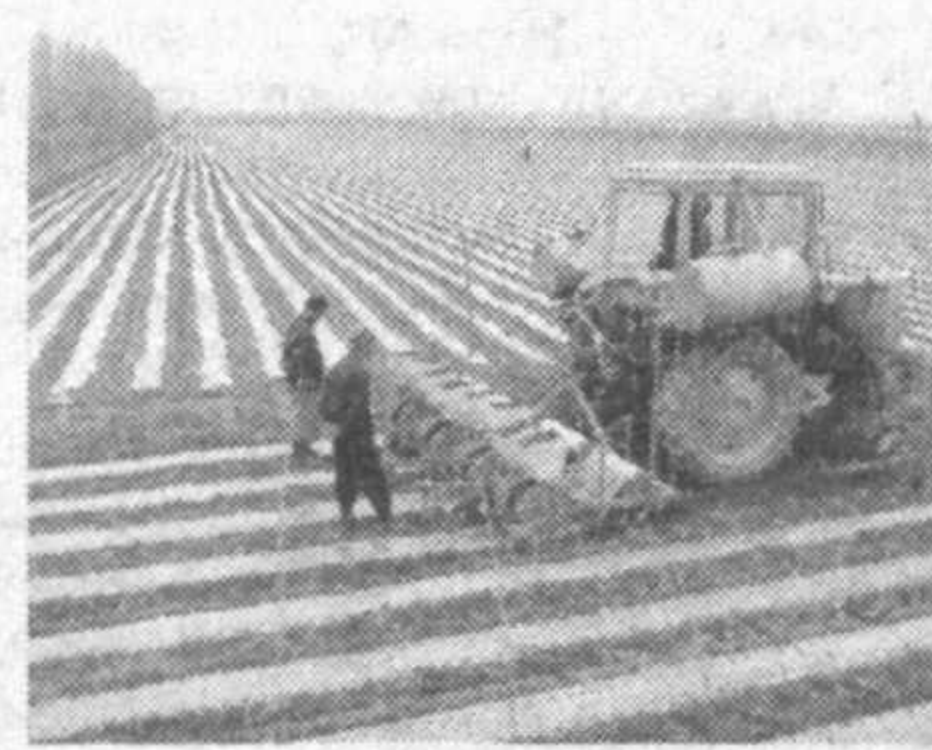
Пахта инсон учун қийин-кечак, либос. Пахтанинг нон мисоли азиз бўлиши, эҳтимол, шундандир.