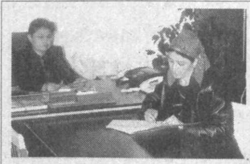
ҳамкорликни мустаҳкамламоқда. Буни банкнинг Учкўрғон филиали фаолиятида ҳам кузатиш мумкин.

Республика ихтисослаштирилган акционерлик тижорат банки — «Галлабанк»нинг ресурс сийсати аҳоли маблағларини омонатларга жалб этиш ва ҳужалик юритувчи субъектларнинг ҳисобварақларидаги бўш маблағларни муддатли ҳамда омонат депозитларига жойлаштириш, улар буйича кўпроқ ликвидли балансни таъминлашга қаратилган. Айни шу йўналишда мазкур молиявий муассаса ўз мижозларига қулайликлар яратиш, ўзаро манфаатли ҳамкорликни мустаҳкамламоқда. Буни банкнинг Учкўрғон филиали фаолиятида ҳам кузатиш мумкин.