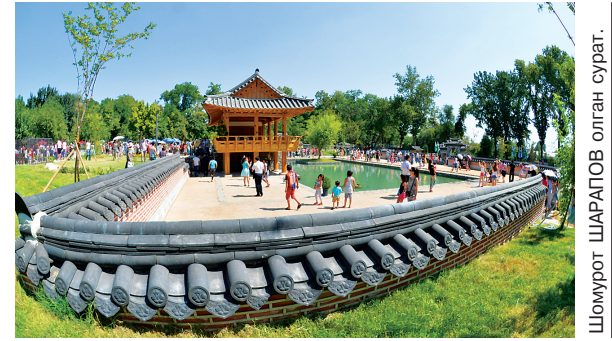
Шоурот ШАРАПОВ олган сурат.

Мустақиллигимизнинг 23 йиллиги кенг нишонланаётган айни кунларда пойтахтимизда янги Сеул боғи фойдаланишга топширилди. Шу муносабат билан ўтказилган маросимда тегишли вазирлик ва идоралар ходимлари, халқаро ҳамда дипломатик корпус вакиллари, юртимиздаги маданият марказлари фаоллари иштирок этди.