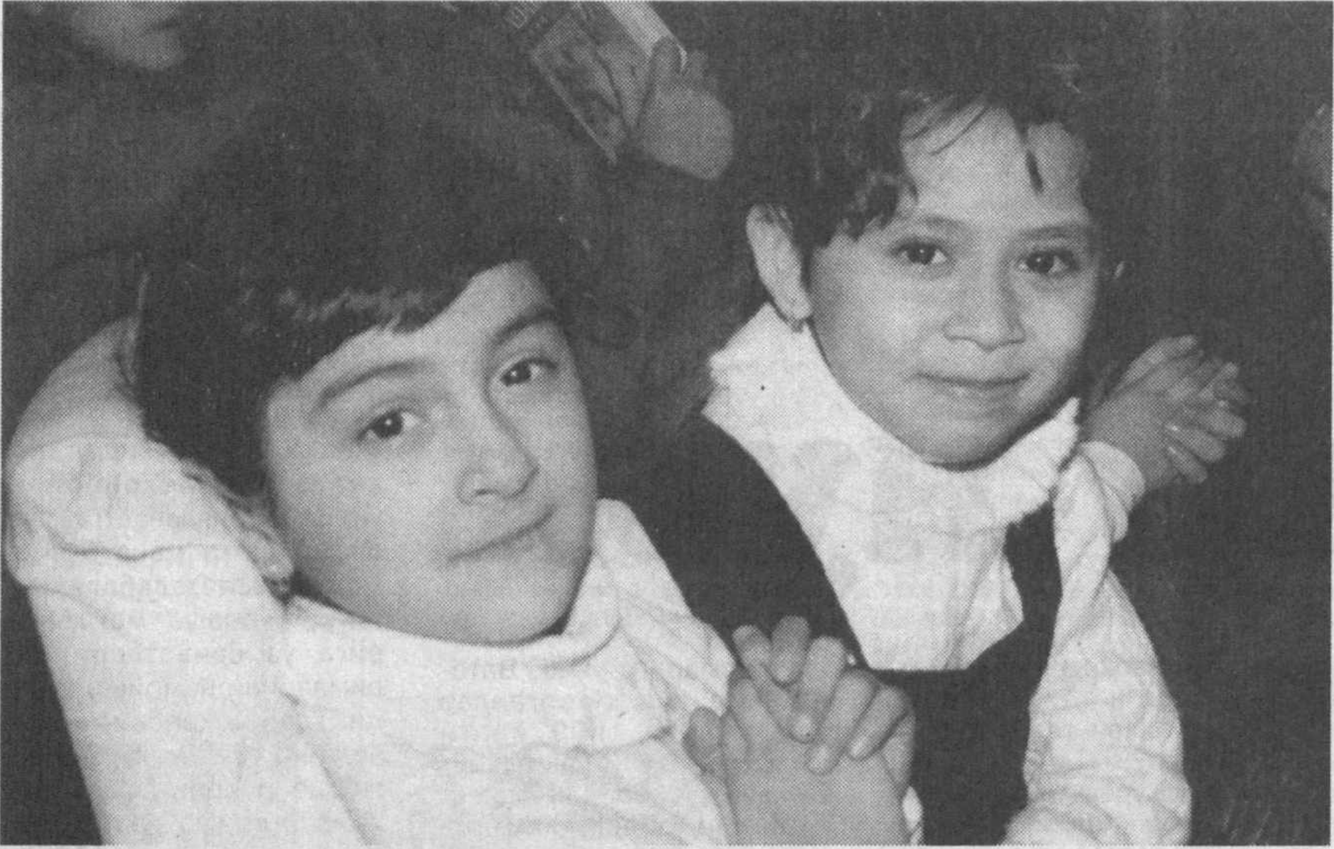
Чақноқ кўзлари жовдираб турган, боқишлари беғубор, самимий шу болажонларнинг бу дунёда беғам, бекам, бедард, беранж яшашлари, кулгилари кўкни қоплаш учун нимаики лозим бўлса барини муҳайё қилгинг келади, кишининг...