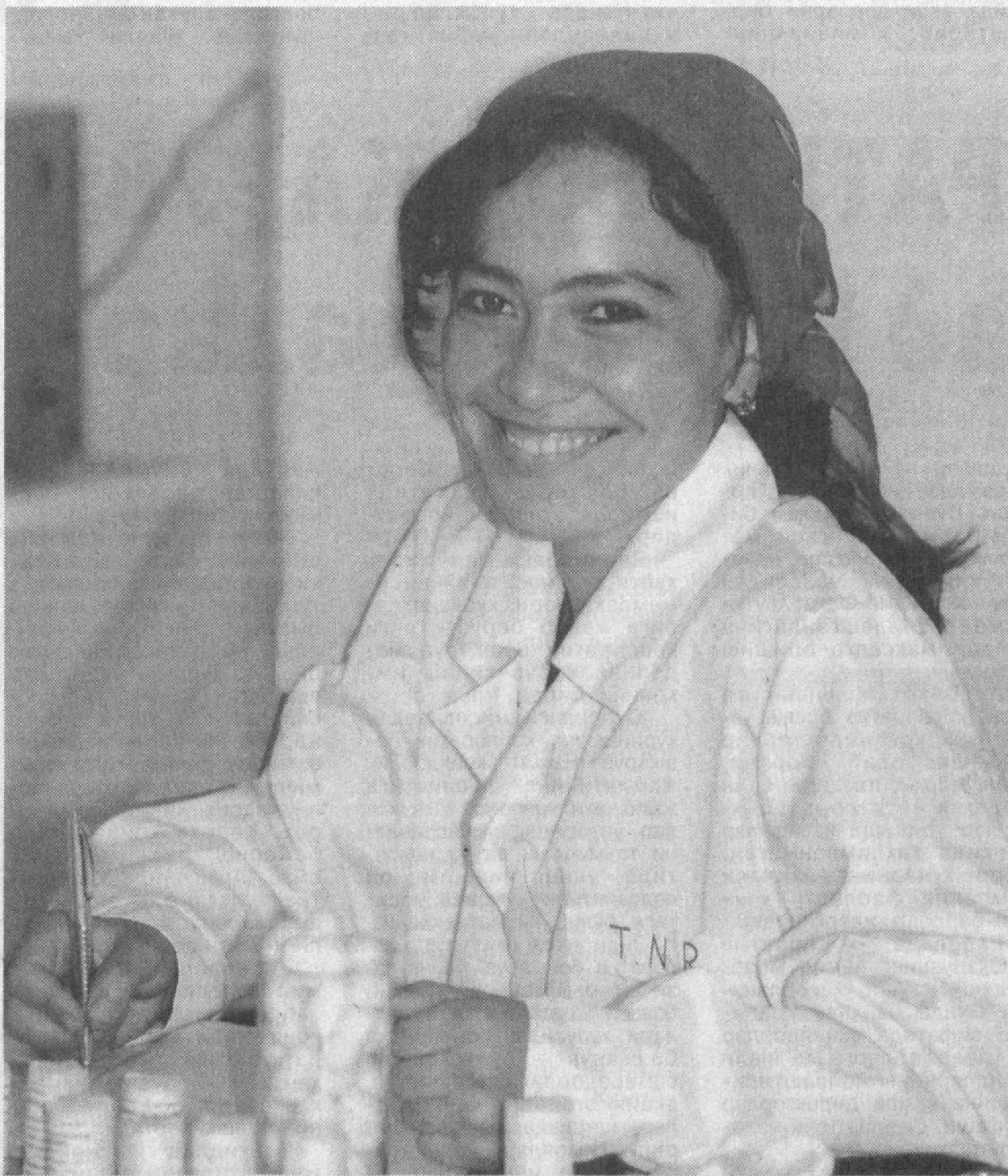
Тошлоқ туманидаги «Садда» фирмаси ташкил этилганга икки йил бўлди. Лекин ўтган қисқа муддатда ишлаб чиқарилган шойи, атлас ва бошқа материаллар ўзининг сифатлиги, ранг-баранглиги билан кўпчилик хариддорларнинг эътиборини тортиди.

Бўлажак сайлов кампаниясига дахлдор ва масъул эканликларини теран англаган матбуот, радио ва телевидение вакиллари анжуманда кўтарилган масала бўйича ўз тақлиф-мулоҳазаларини ўртоқлашдилар.