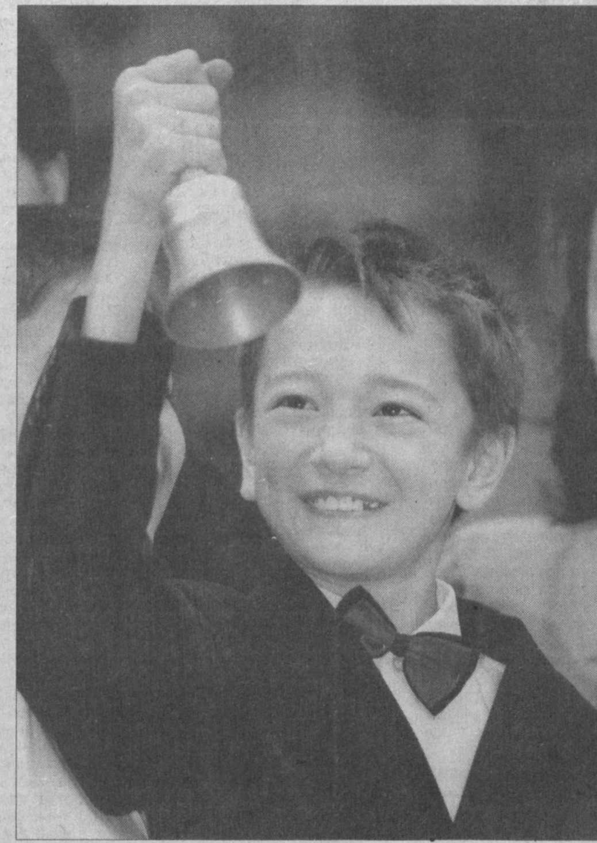
Улар ҳақида маҳаллий «La Riviera» газетасида ҳам ёзилади.

Гимназия фаолияти шонч, умид турбди. Дунёнинг турли мамлакатларидан келган 2000 нафар ўқувчи орасида гимназия ўқувчилари фольклор жанрида фахрли 1-ўринни эгаллашди. Бу билан улар ёш бўлишига қарамай, юртимиз номини яна бир бор дунёга таратдилар.