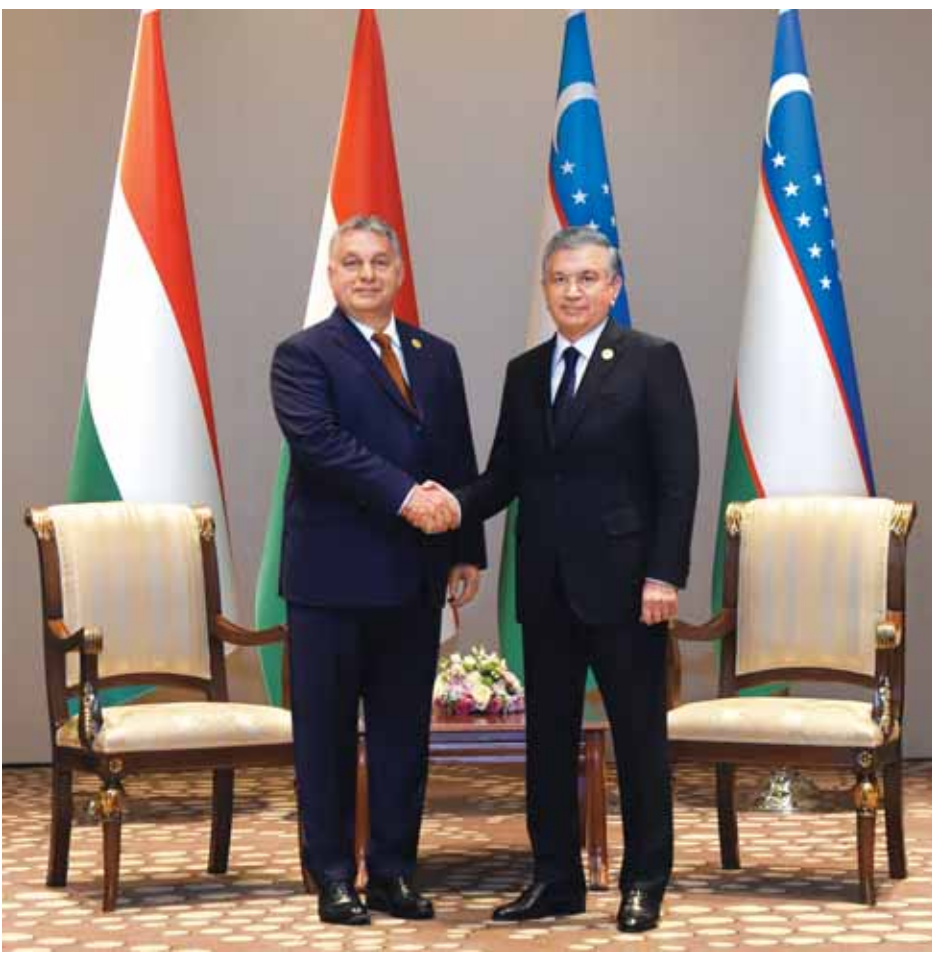
Ўзбекистон Республикаси Президенти Матбуот хизмати суратлари.