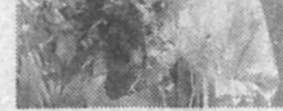
Ҳиндистон янги ҳукумати бундан бир йил олдин бошланган тинчлик борасидаги музокараларни яна давом эттириш ниятида.