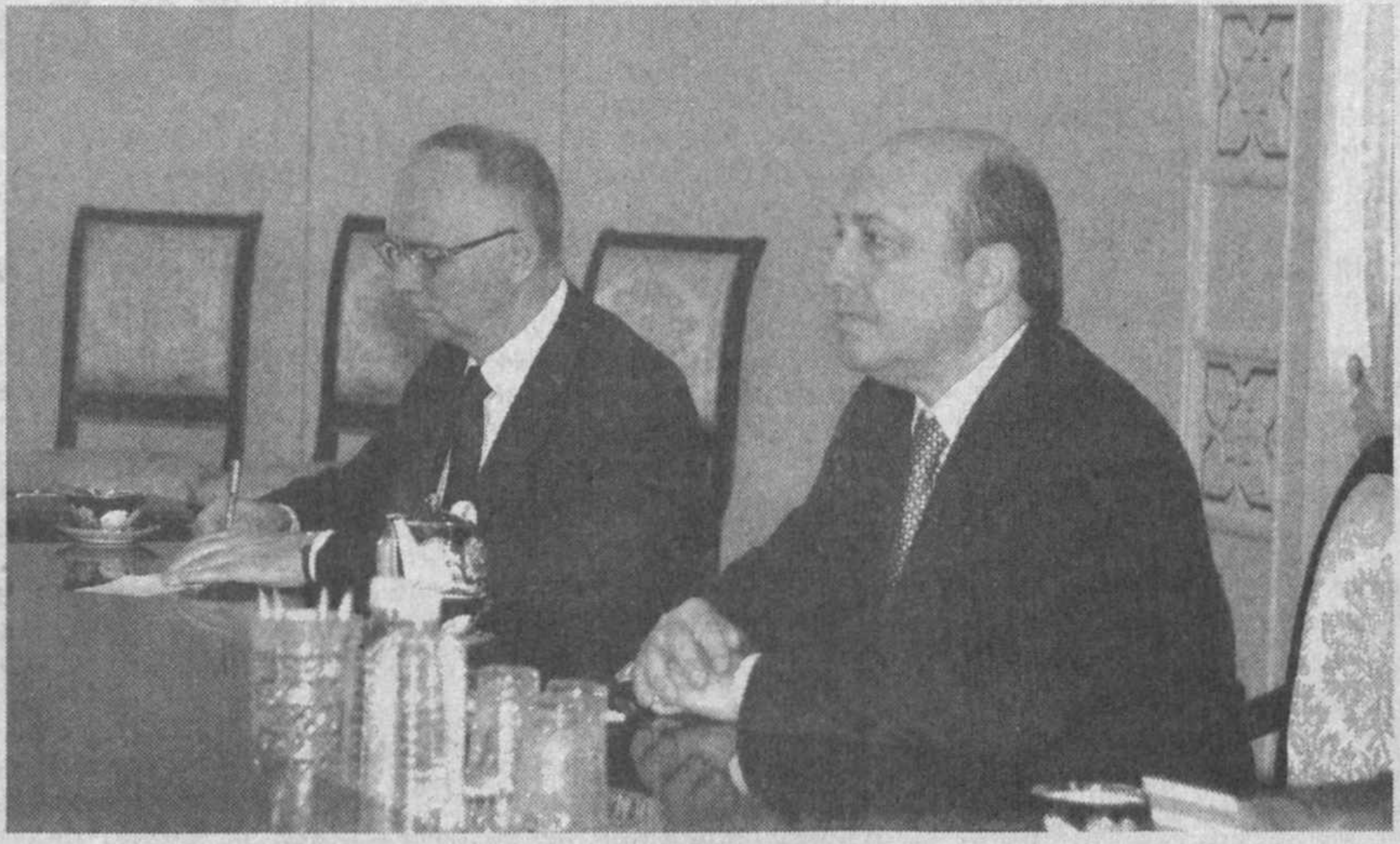
Ўзбекистон Республикаси Президенти Ислам Каримов 3 июнь кунни Оқсаройда Россия Федерацияси Хавфсизлик кенгаши котиби Игор Ивановни қабул қилди.

Ислам Каримов меҳмонни юртимизга ташрифи билан кутлар экан, ушбу учрашув мамлакатларимизнинг хавфсизлик соҳасидаги ҳамкорликга доир масалаларни муҳокама қилиш учун яна бир имконият эканлигини таъкидлади. Зеро, давлатимиз раҳбарининг шу йил апрель ойда Россияга ташрифи чоғида Ўзбекистон ва Россия муносабатлари ўз тараққиётининг янги bosqichiga кўтарилаётгани таъкидланган эди.