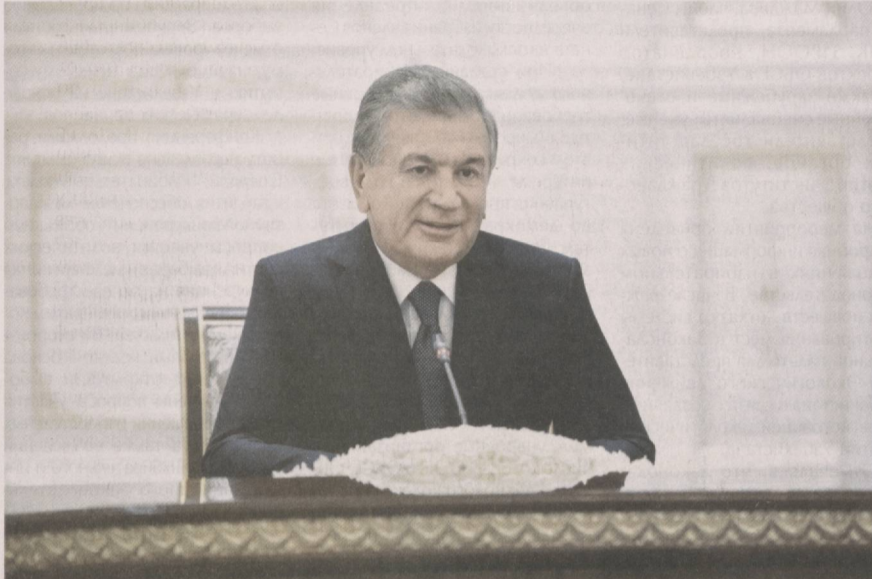
Президент Республики Узбекистан Шавкат Мирзиёев 7 октября принял делегацию Республики Таджикистан во главе с председателем Маджлиси Намояндагон Маджлиси Оли этой страны Шукурджоном Зухуровым.

Приветствуя гостей, глава нашего государства с глубоким удовлетворением отметил, что установившийся регулярный и доверительный диалог на высшем уровне позволил вывести двустороннее сотрудничество на беспрецедентно высокий уровень. В этой связи прибитие в Узбекистан парламентской