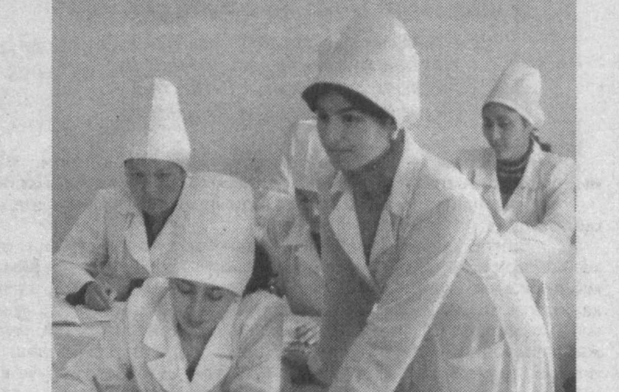
Эллиқалъа туманидаги тиббиёт коллежи Қорақалпоғистондаги энг нуфузли ўқув даргоҳларидан ҳисобланади. Айни пайтда коллежда меҳнатқашларнинг 600 нафар фарзандлари таълим олмақда...