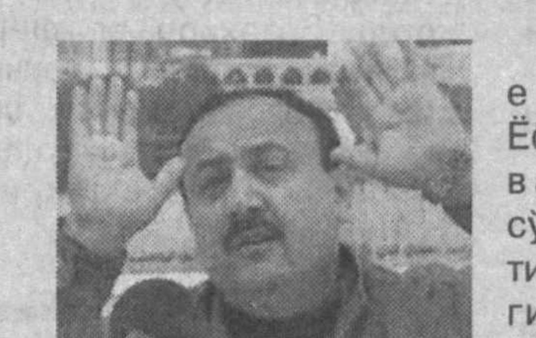
нинг 9 январь кунини бўлиб ўтиши маълум қилинган мухторият раислигига

Авалроқ эришилган келишувларга қўра, Болгария 2007 йилда Еуропа Иттифоқига қўшилиши кўзда тутилган эди.