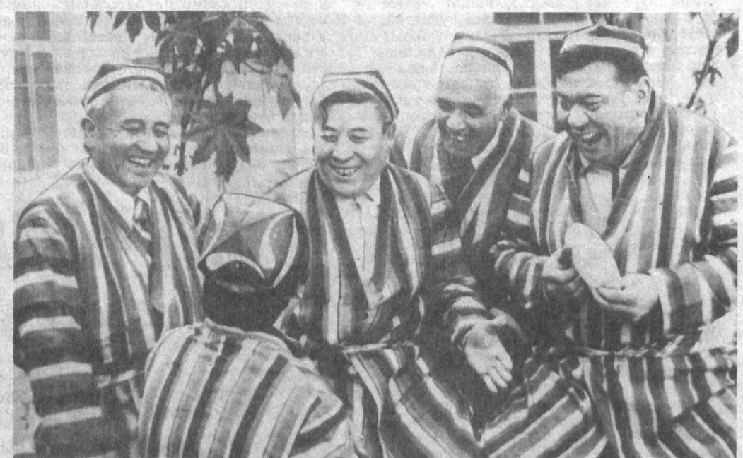
Кулинг, умрингиз узадн.